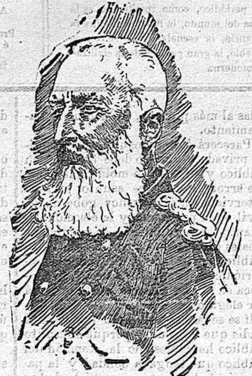
Leopoldo II de Bélgica.

Leopoldo II quiere dar á sus hijos una severa lección, por ellos bien costosa, porque según todas las apariencias, mermará sus futuros patrimonios en unos cuantos millones.