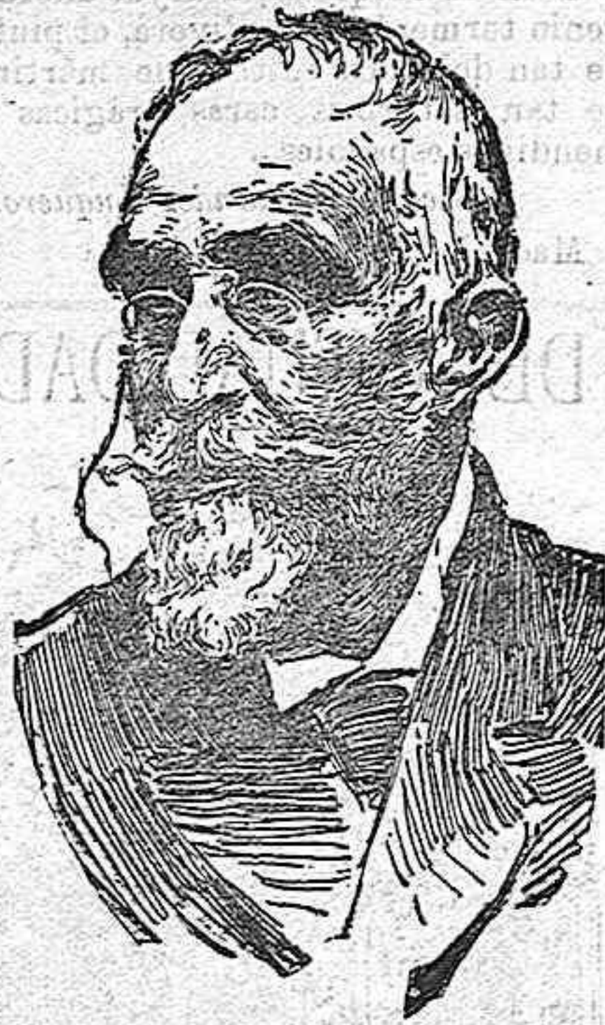
Don Gumersindo Azcárate.

Esta es la nota política más saliente en estos días. Que el señor Azcárate, cuyos talentos como hombre público nadie ha puesto en duda, es un carácter todo civismo, honradez y seriedad, es cosa también harto reconocida; pero si así no fuera, nos bastaría para proclamarlo á los cuatro vientos su renuncia al acta de diputado y su propósito de retirarse á la vida privada, en busca del descanso y la tranquilidad á que tiene derecho tras larga vida política en que ha derrochado generosamente energías y vitalidades sin cuento.