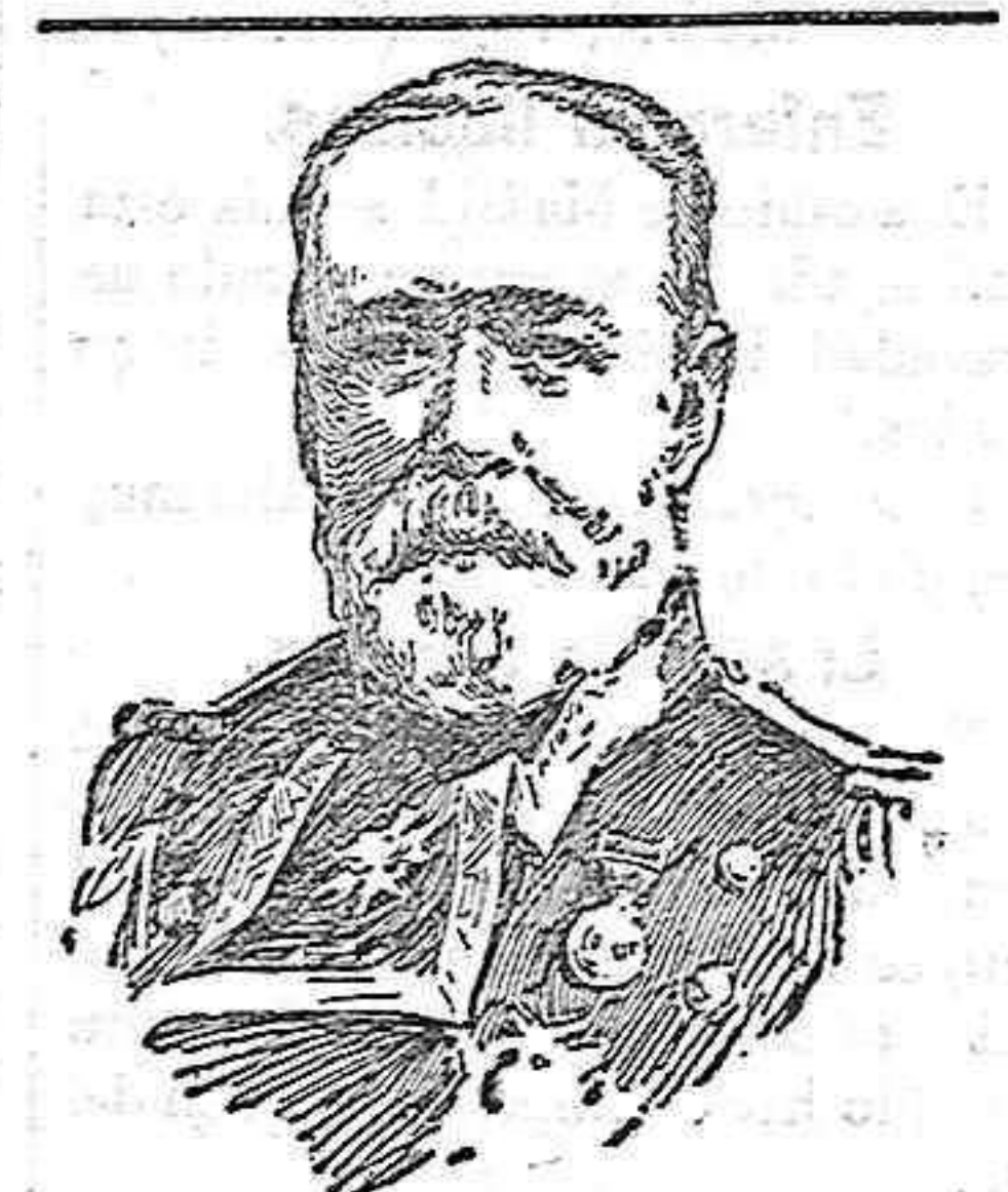
El vicealmirante Cervera, el cual se halla gravemente enfermo.

En Madrid, donde no se sabe como se les arreglan para vivir las tres cuartas partes de la población, se gastaron en toros, cines y teatros 5'60 millones en 1908 contra 5'27 en 1907; y no hay que achacarlo á la población flotante que haya aumentado, pues de ello protestarían los dueños de los hoteles y fondas, que se quejan de lo contrario.