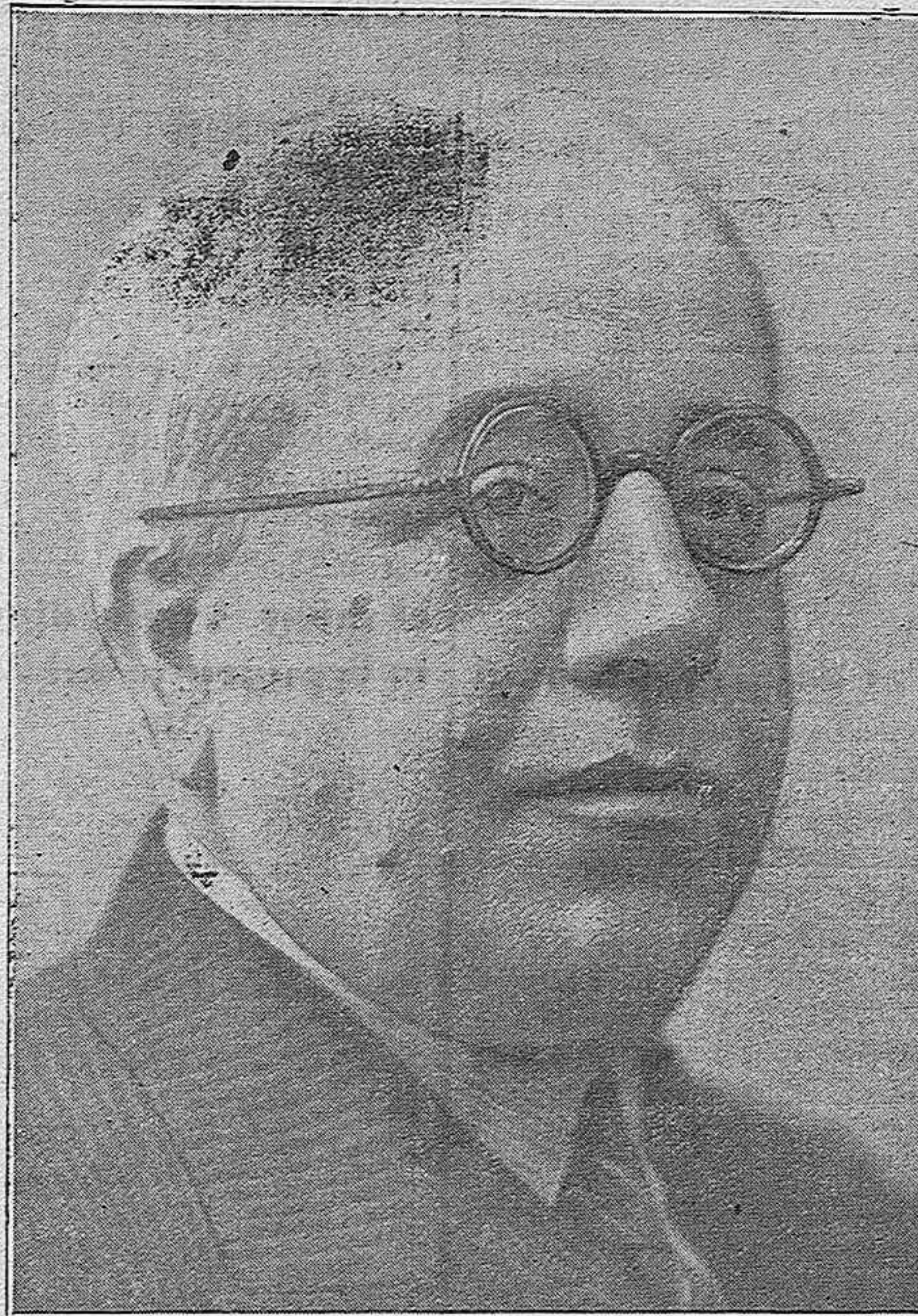
Su excelencia el presidente de la República

Los concurrentes puestos en pie vitorean a la República con entusiasmo.