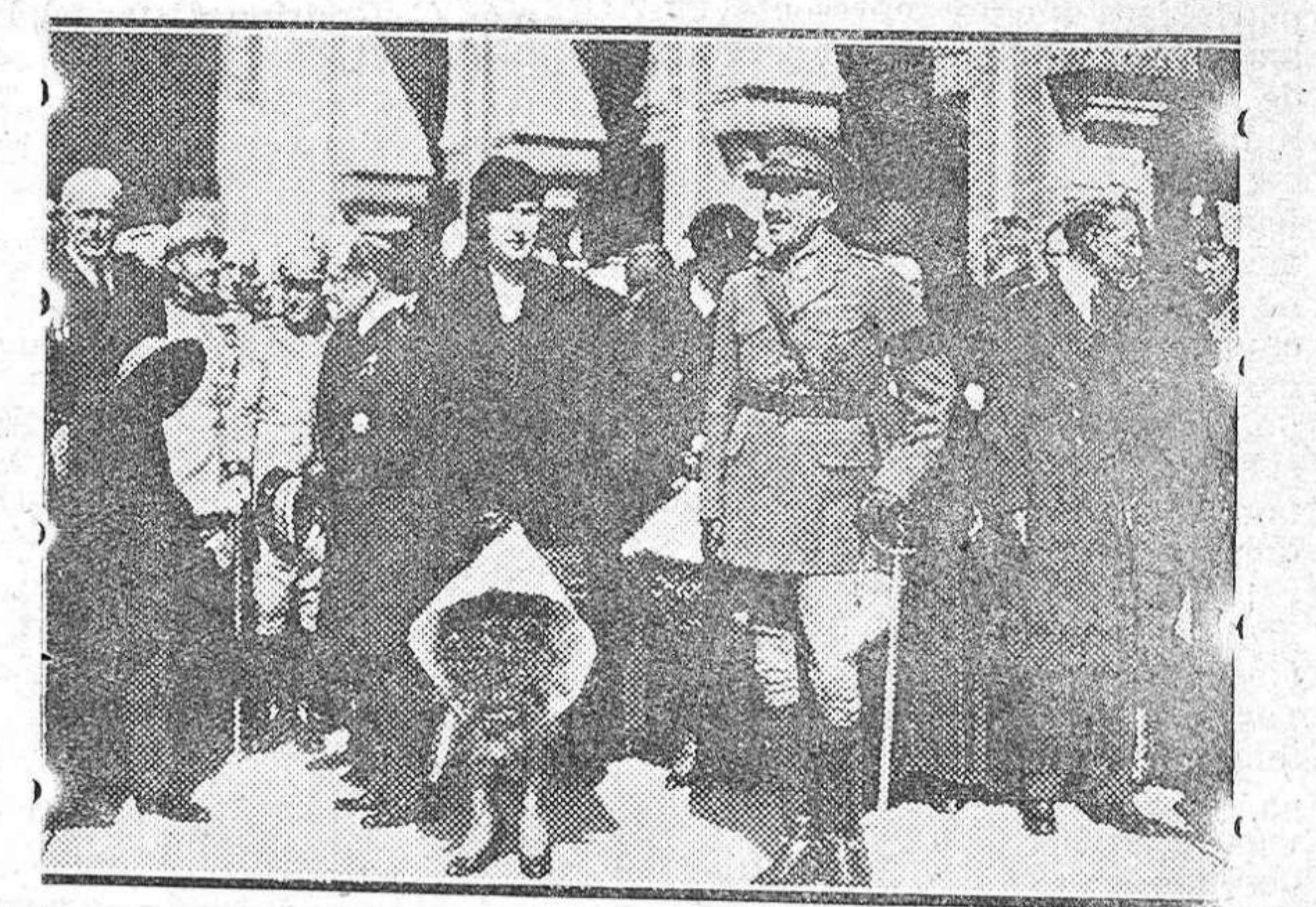
S.S. MM. los Reyes don Alfonso y doña Victoria, al salir de uno de los pabellones americanos de la Exposición sevillana.