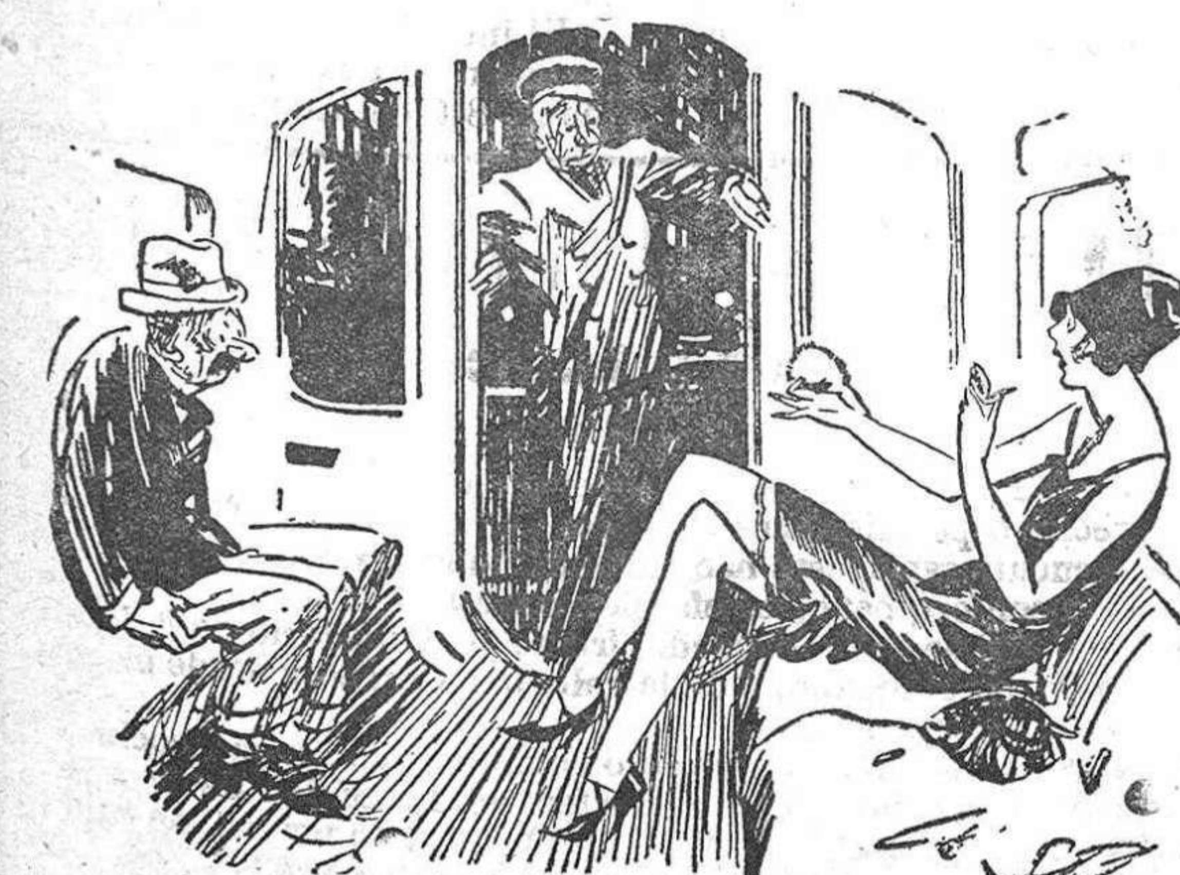
—Cobrador, haga el favor de llamar a un agente. Ese hombre no deja de mirarme.