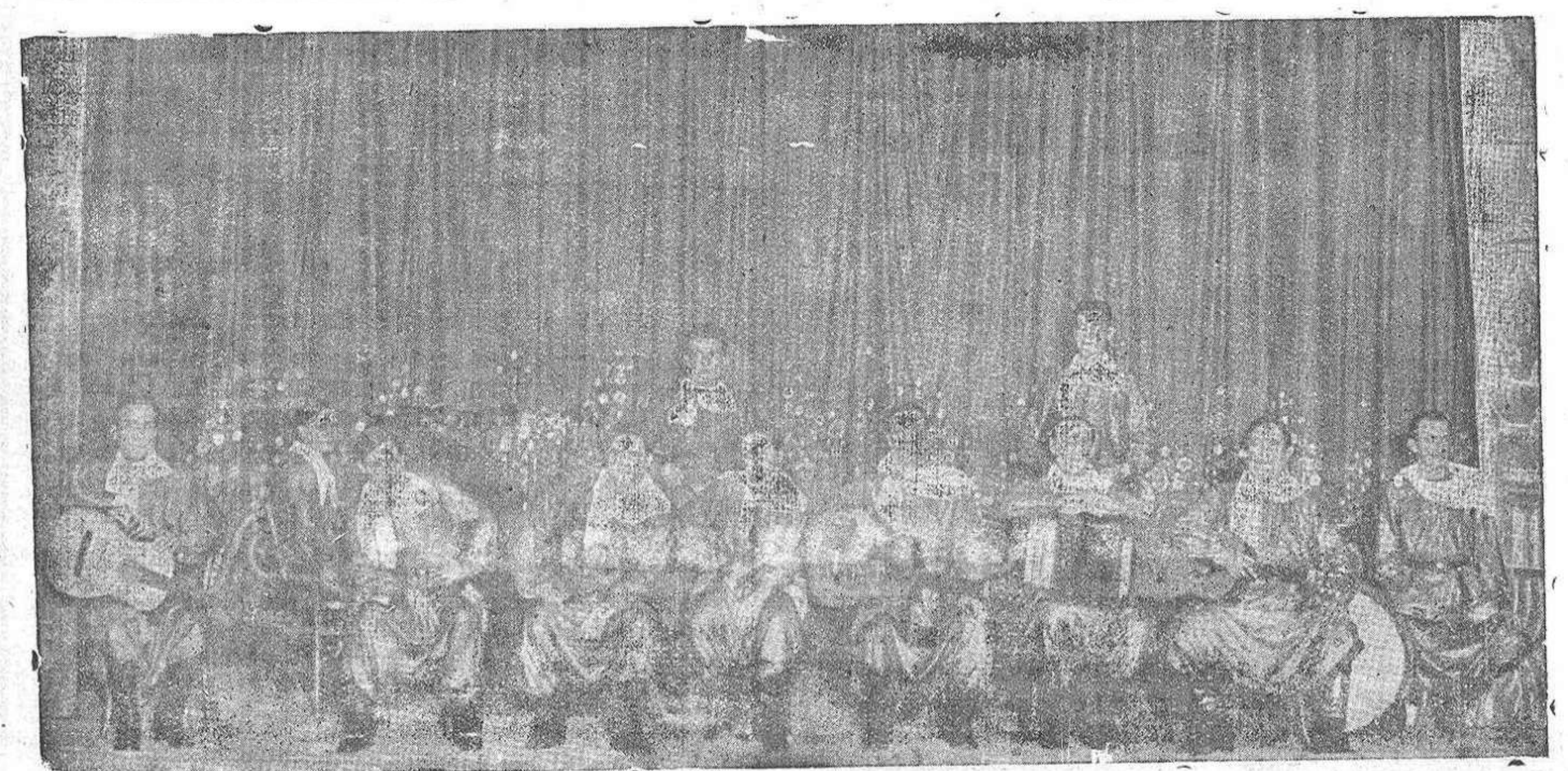
La orquesta ALMA CRIOLLA, del Principal Palace, de Barcelona, que debutará el sábado en el Teatro Principal, continuando en el mismo durante los próximos Carnavales.

Pida usted en toda España el nuevo y acreditado Neumático