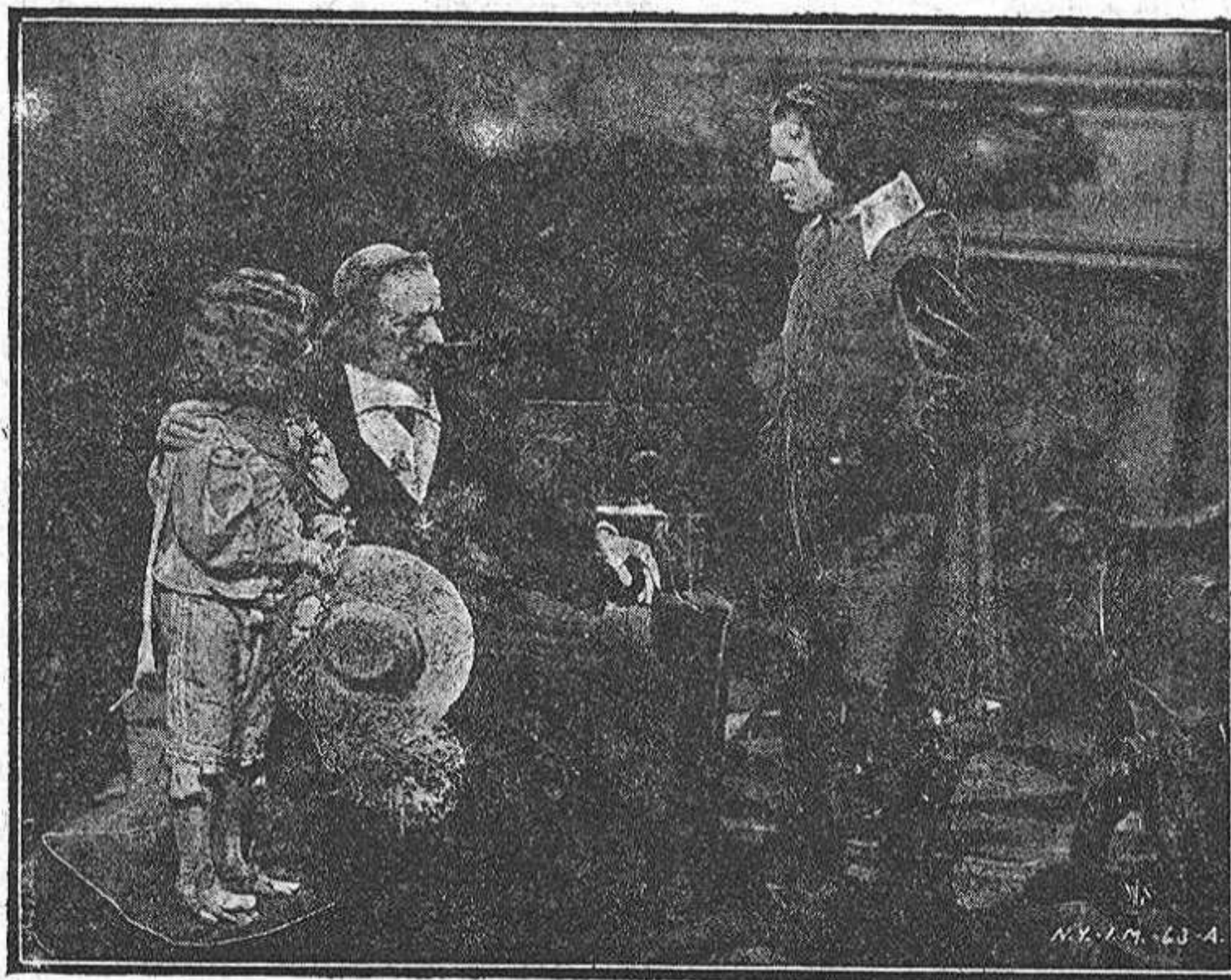
Una escena de la gran película "La Máscara de Hierro". La cumbre creación de Douglas Fairbanks, que se estrena mañana en el TEATRO PRINCIPAL