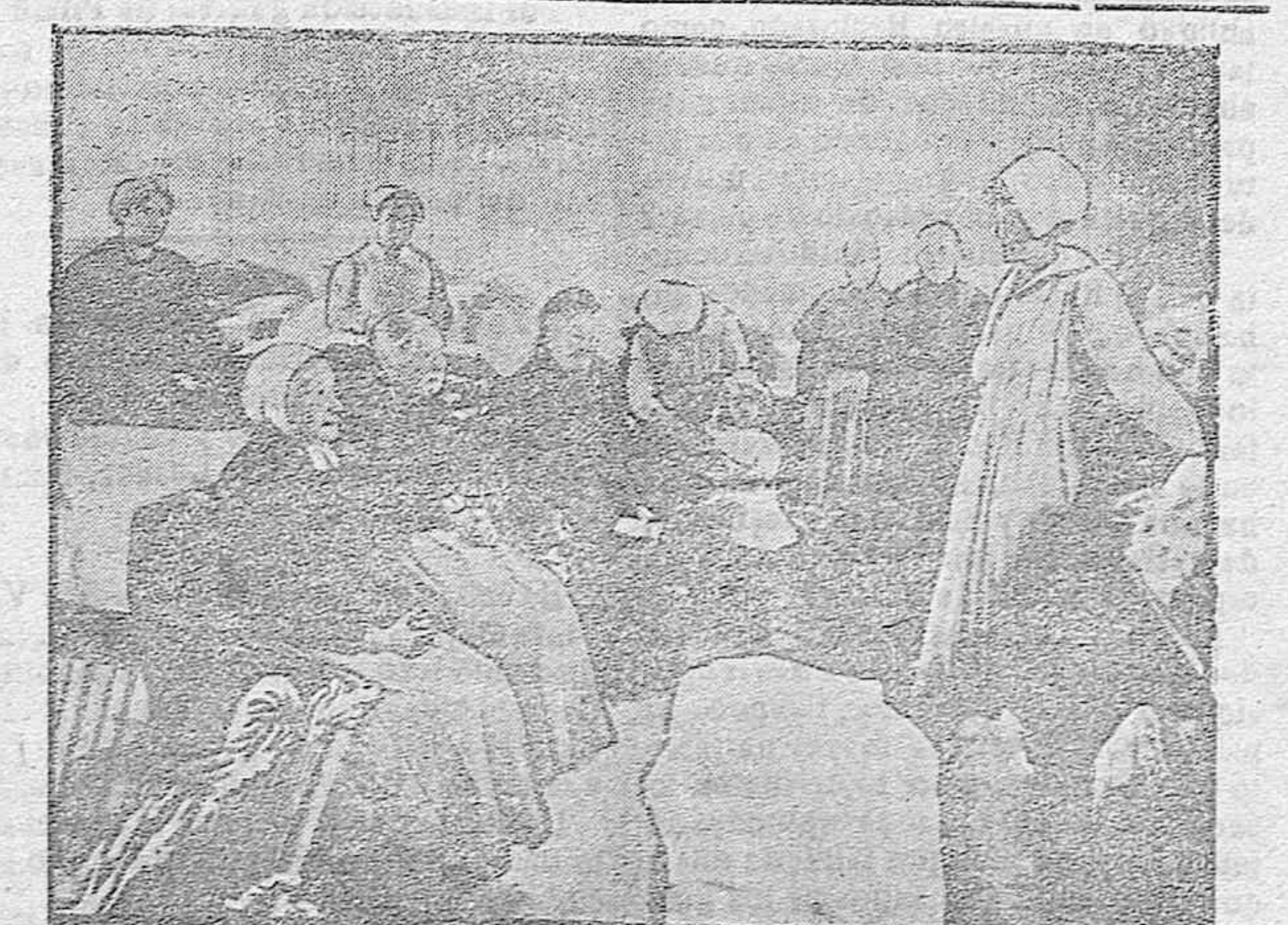
DR LA GUERRA.—Dama del Comité de Socorros americanos repartiendo vestiduras a los habitantes del Aisne.