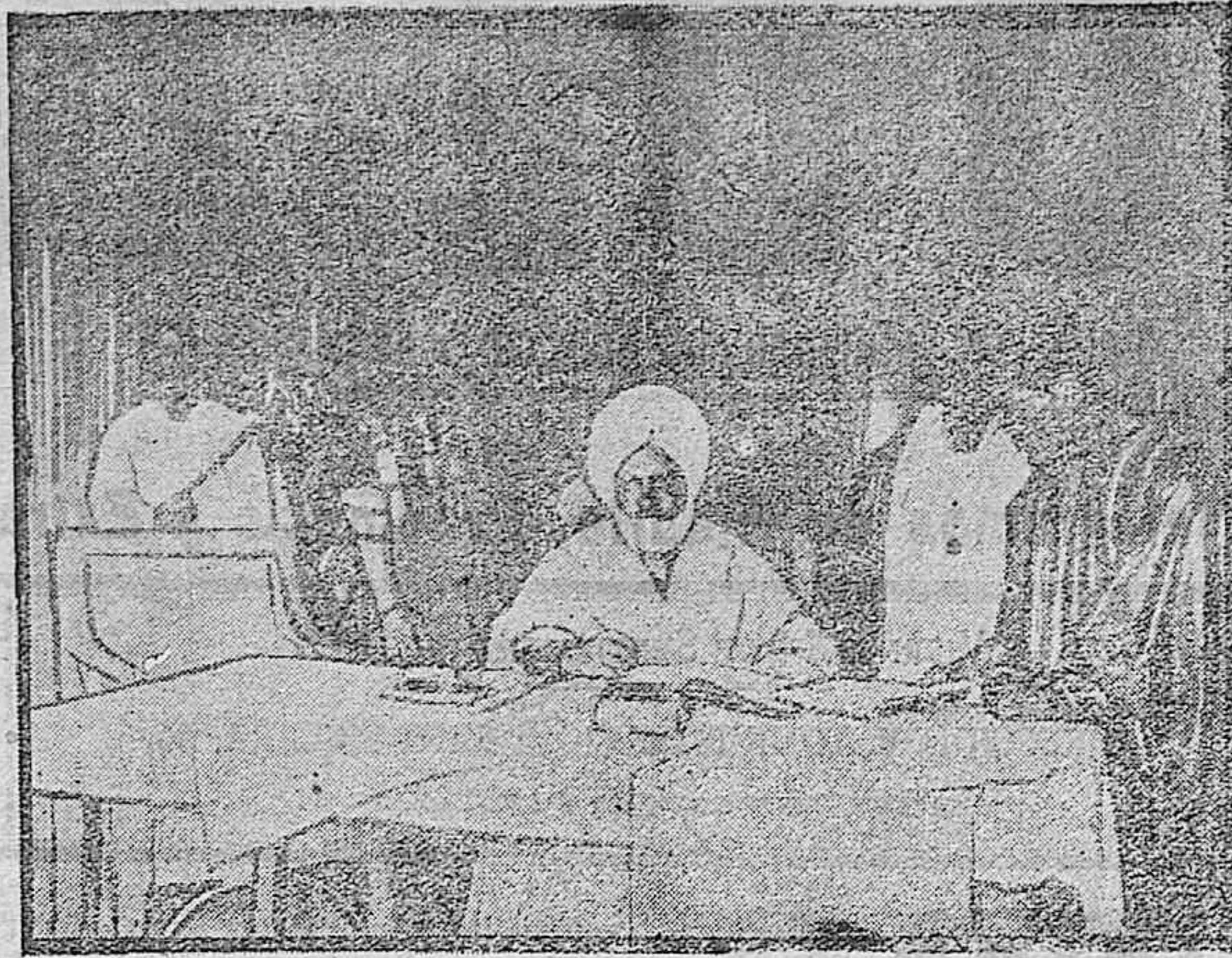
APUNTES DE LA GUERRA.—En el Camerón. El Saltán Famiban en su despacho

Durante el día de ayer en que el número de forasteros superó a todo cálculo, los cafés y fondes, tiendas y demás establecimientos mercantiles vieron muy concurridos.