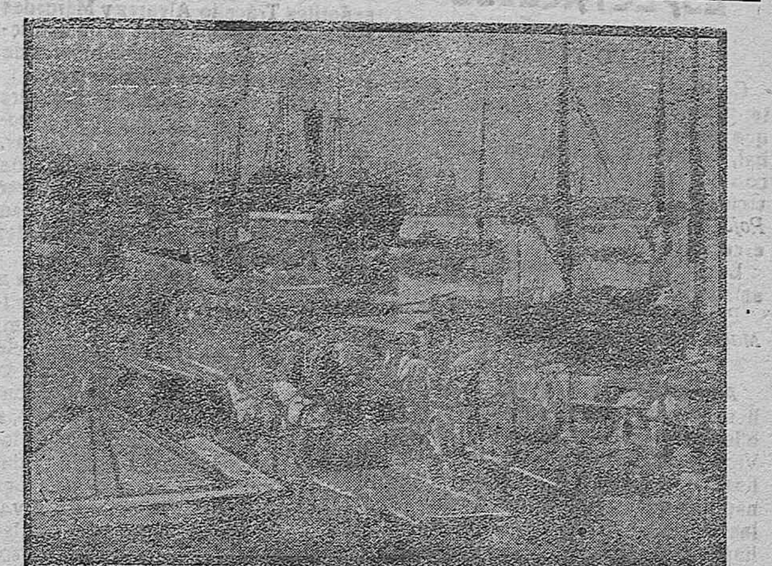
APUNTES DE LA GUERRA.—Los muelles de Burdeos.