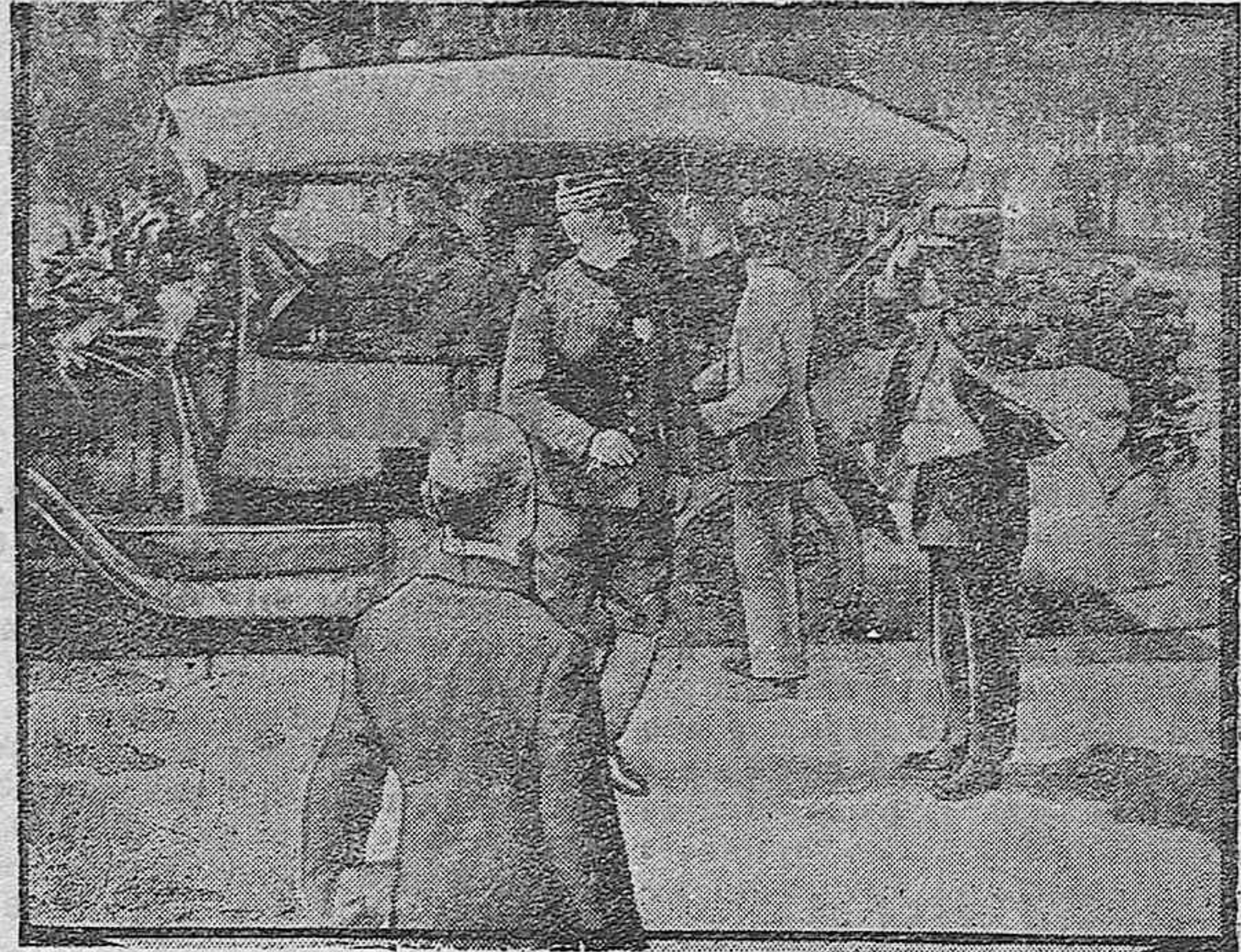
APUNTES DE LA GUERRA.—El general Barail en una visita de inspección.

1.º El nitrógeno favorece el desarrollo de la parte herbácea, mientras que el ácido fosfórico y la potasa influyen más directamente en la fructificación, y por tanto cuanto más joven sea el viñedo y más débiles los arriamientos, mayor debe ser la propor-