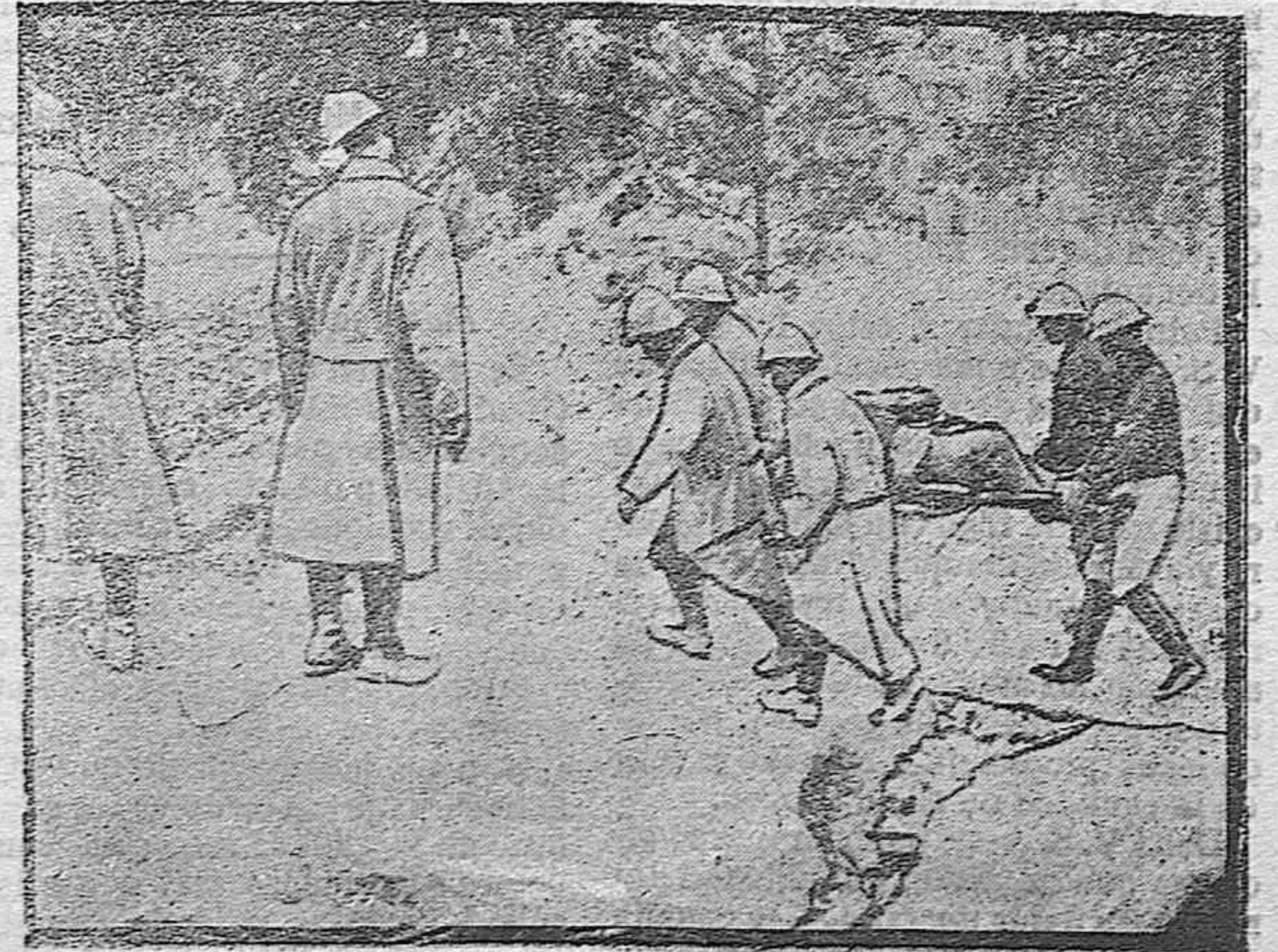
APUNTES DE LA GUERRA.—Trasporte de un herido al puesto de socorro.

La Compañía de explotación de los ferrocarriles de Madrid a Cáceres y Portugal y del Oeste de España tiene el honor de poner en conocimiento del público que, con objeto de facilitar la concurrencia a la feria y fiestas que han de celebrarse en Benavente durante los días 6 al 11 del próximo mes