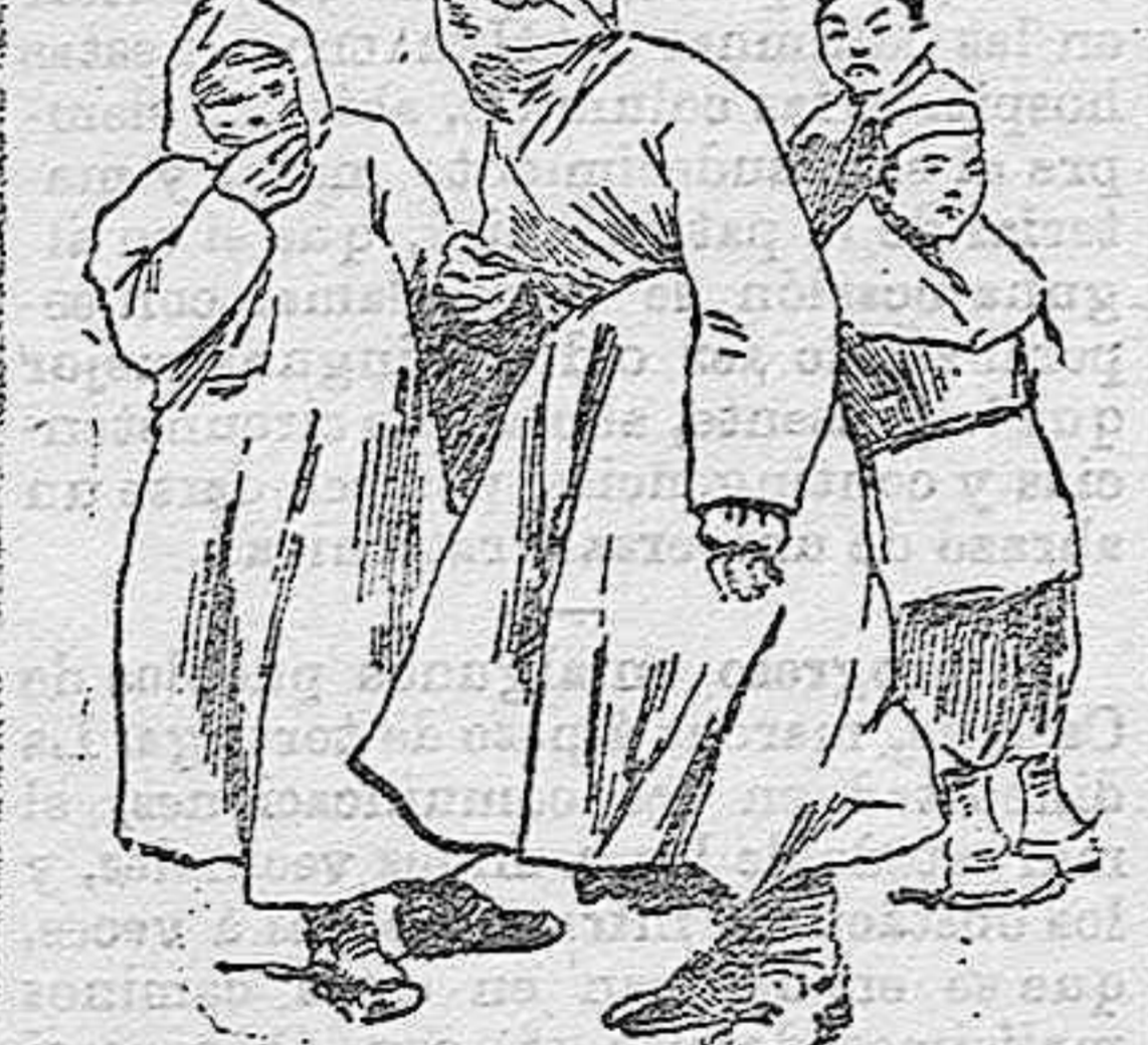
Traje usado por los médicos en la Mandchuria para librarse de la peste.