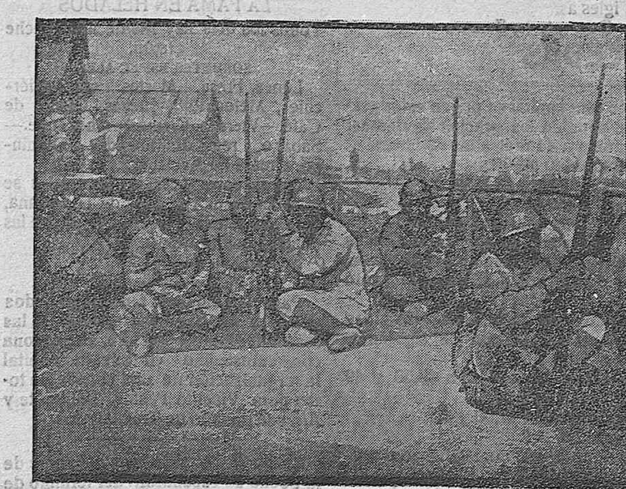
ESCENAS DE LA GUERRA.—Tiradores anamitas limpiando sus armas.

Ya se ha publicado la convocatoria del Congreso, en cuyo texto, amplio y enérgico, se dice que como los Municipios representan la verdadera volun-