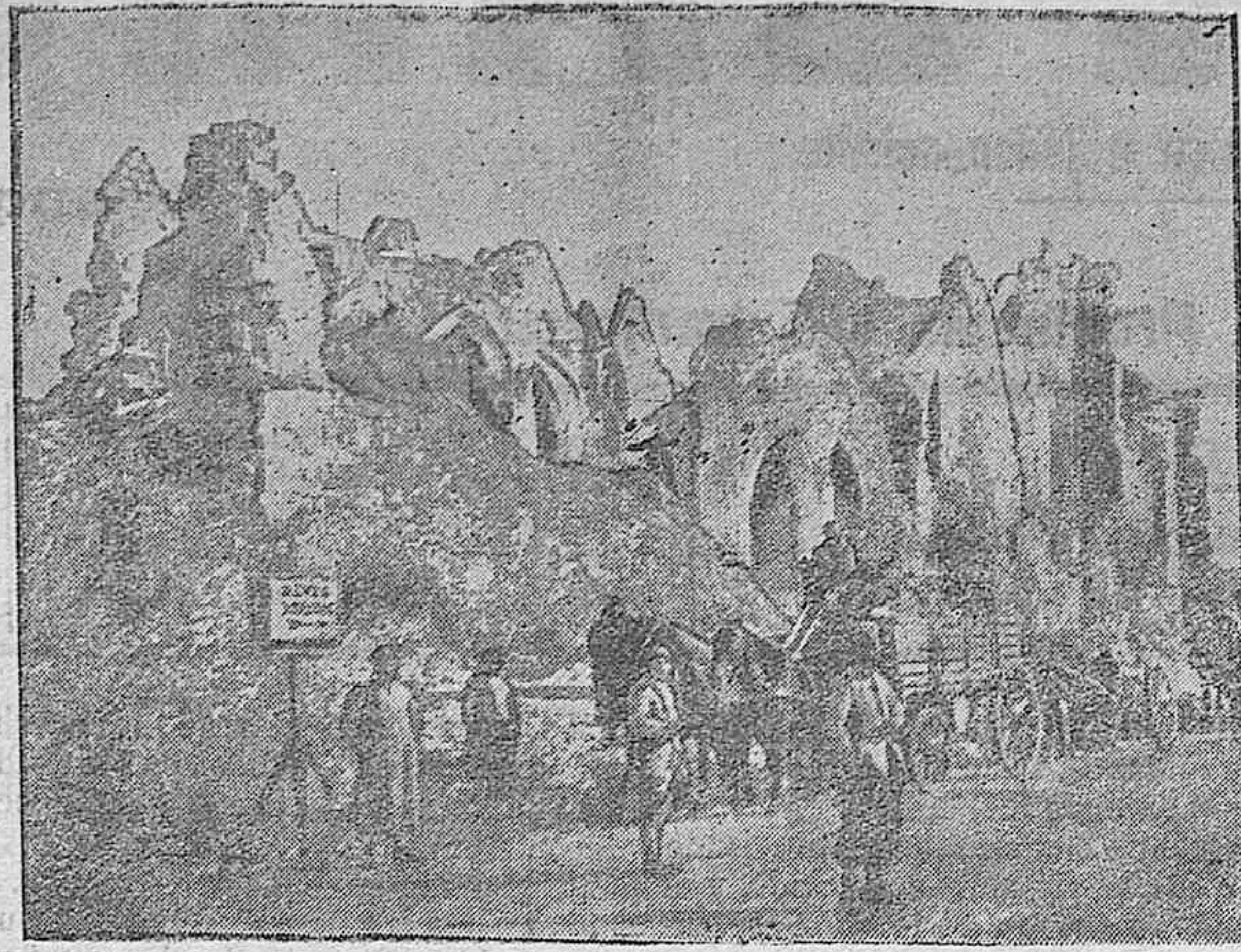
La iglesia de Lassigneg destruida por los alemanes en su huida.

lentes. La ciudad no puede mostrarse insensible al progreso y de ir debe bracer con él, por mandato municipal. En los salones del Concejo parece que por móviles no exclusivamente políticos ni filosóficos, canta la divisa del gran poeta de la Italia: «O renovarse o morir.»