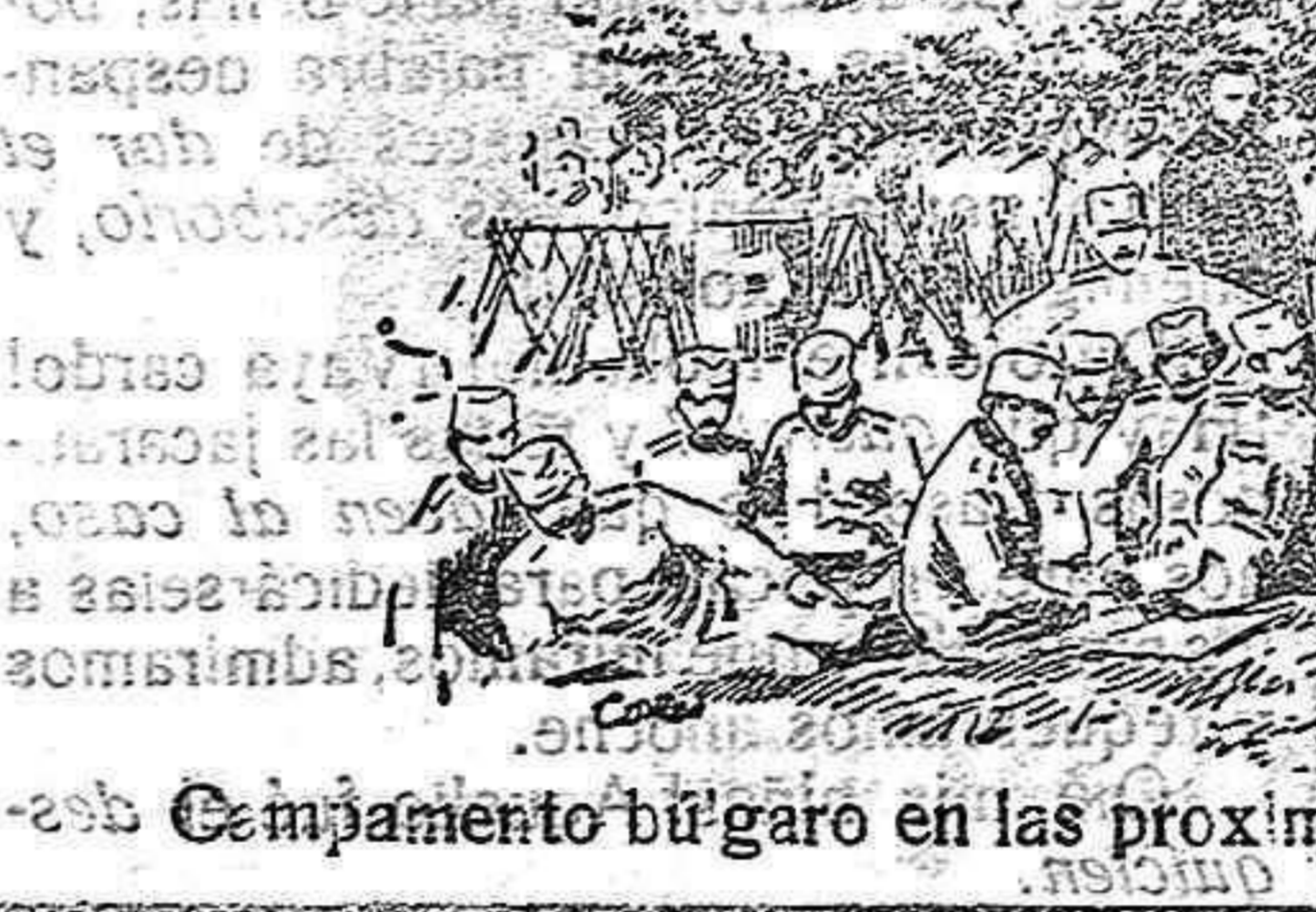
Campamento búlgaro en las proximidades de la línea de Tshatalja.