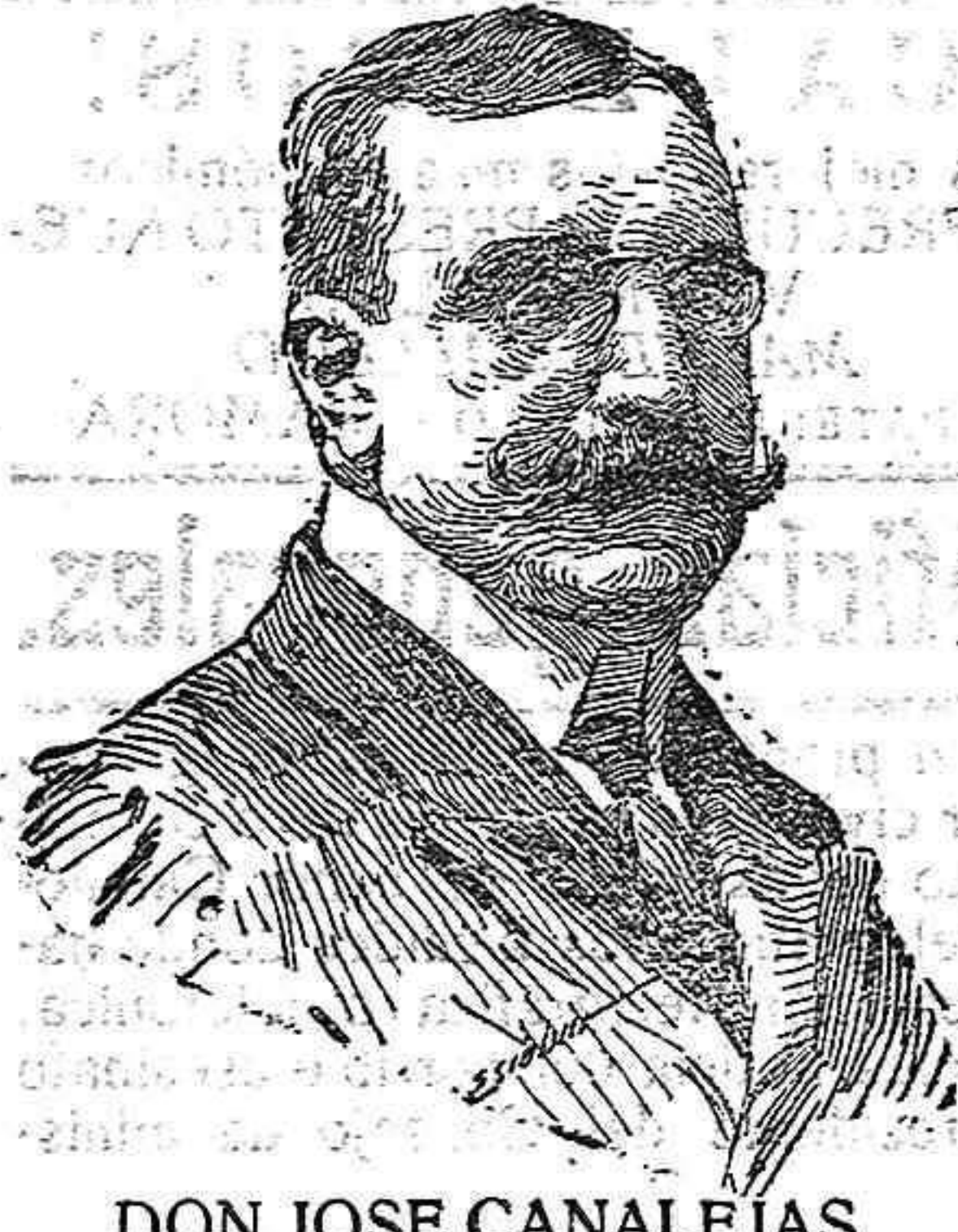
DON JOSE CANALEJAS

en plata y 1,50 en calderilla; un retrato de mujer con la siguiente dedicatoria: «A mi inolvidable Manuel», un cuaderno con algunos apuntes de medicina y otro manuscrito con el título Conflagración Internacional.—París . Además, le ha sido también ocupada una partida de bautismo a nombre de Manuel Pardiñas Serrato, natural de Graus (Huesca), que, según parece, se sospecha no sea auténtica, y por tanto, fingido el nombre que usaba.