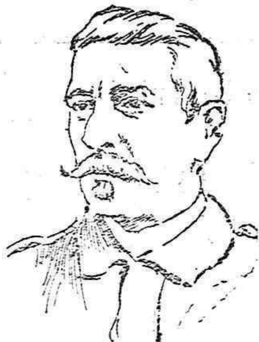
EL GENERAL ROS