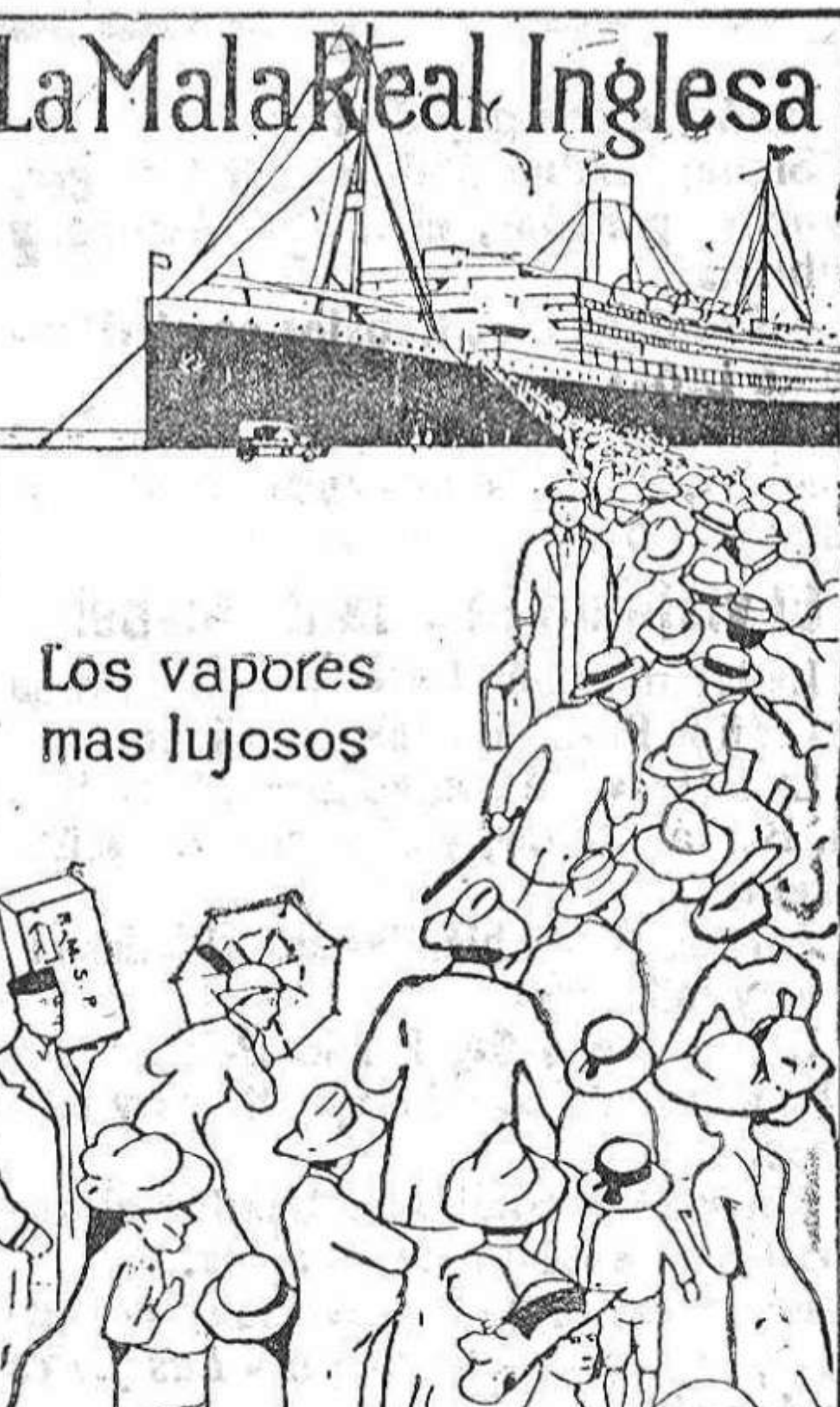
Los vapores mas lujosos

PERNAMBUCO BAHIA RIO JANEIRO SANTOS MONTEVIDEO Y BUENOS AIRES