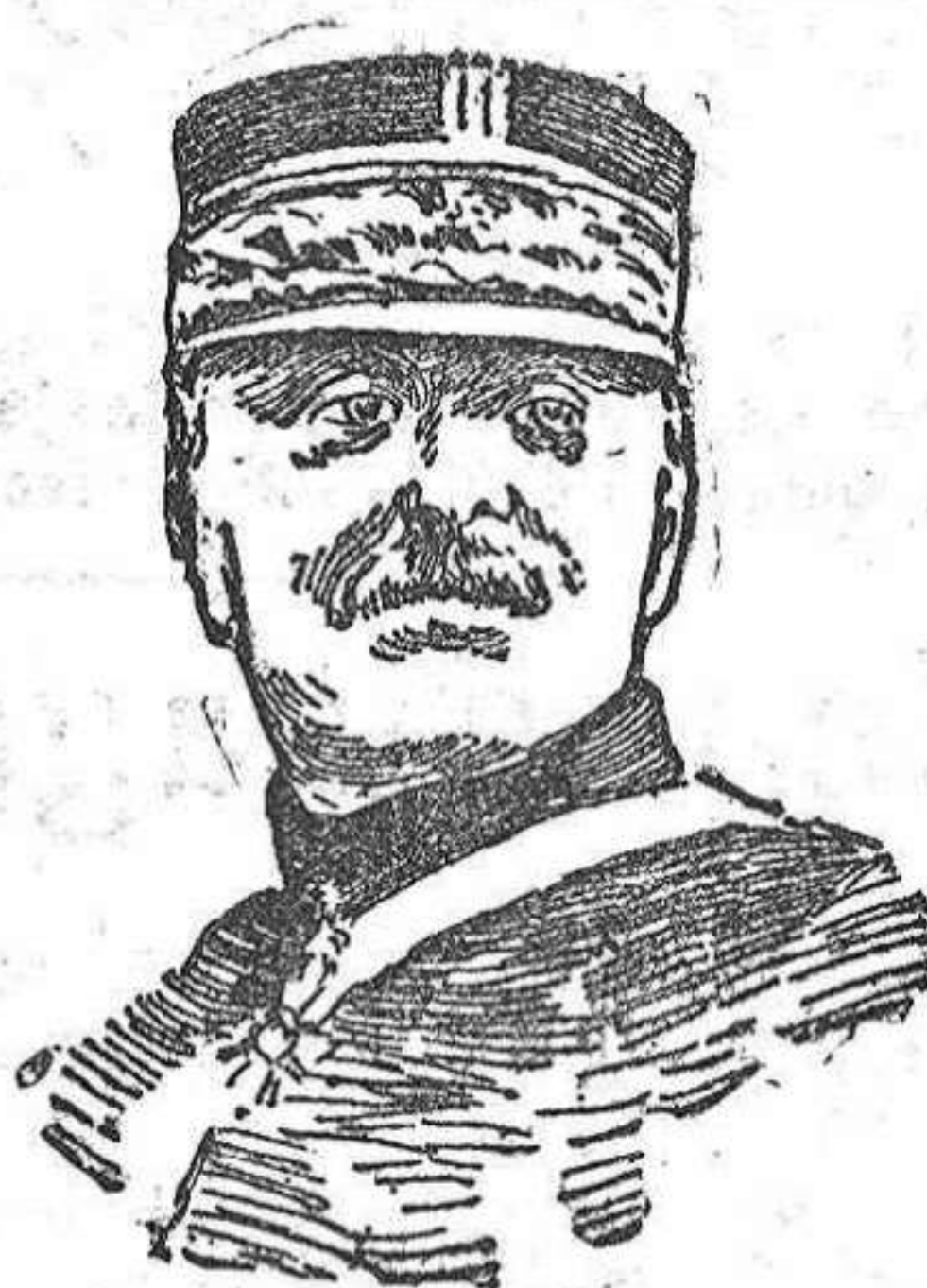
General De Manchua que manda los batallones alpinos franceses que operan en los Vosgos — y en Alsacia —

Y a los rusos, de nuevo, a sus casas verémoslos ir... pues no habrá un enemigo en Oriente a quien combatir... Emilio Mato.