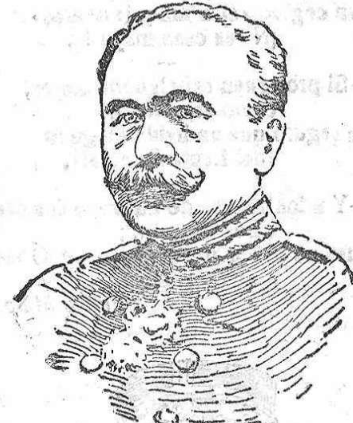
General francés de Laugle de Cay, que mandó uno de los cuerpos de ejército que tomaron parte en la actual ofensiva.