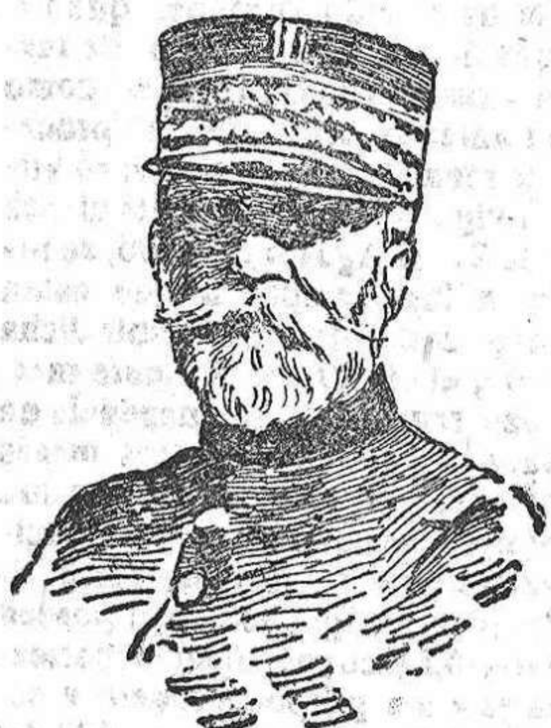
General Sarraill, que manda el ejército francés que pelea en la península de Gallipoli.

En suma, que en las naciones aliadas—¡bueno val— por sus bravas incursiones, cada vez hay más teutones... prisioneros, claro está. Emilio Mato.