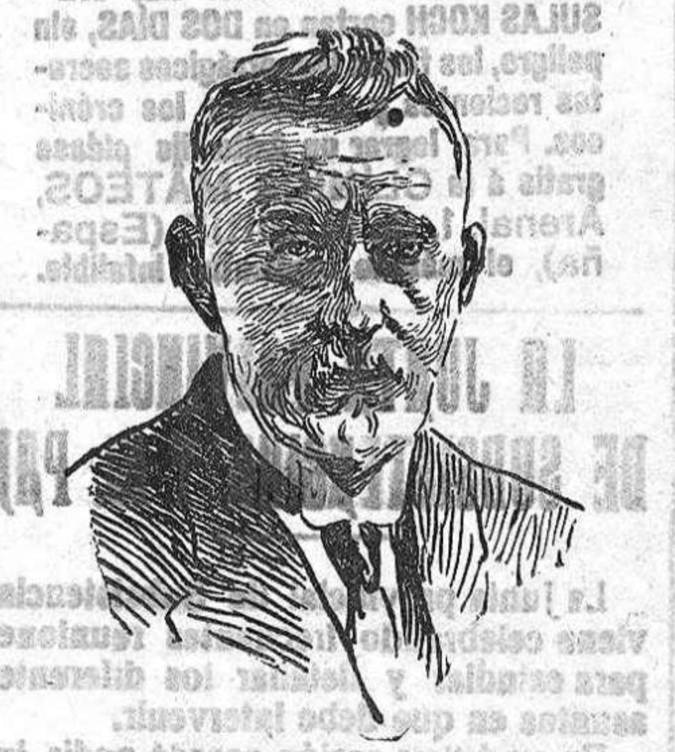
El famoso médico alemán, inventor del 606, doctor Ehrlich, fallecido en Francfort.

Se instruye el correspondiente proceso. El Corresponsal. 21-8-1915.