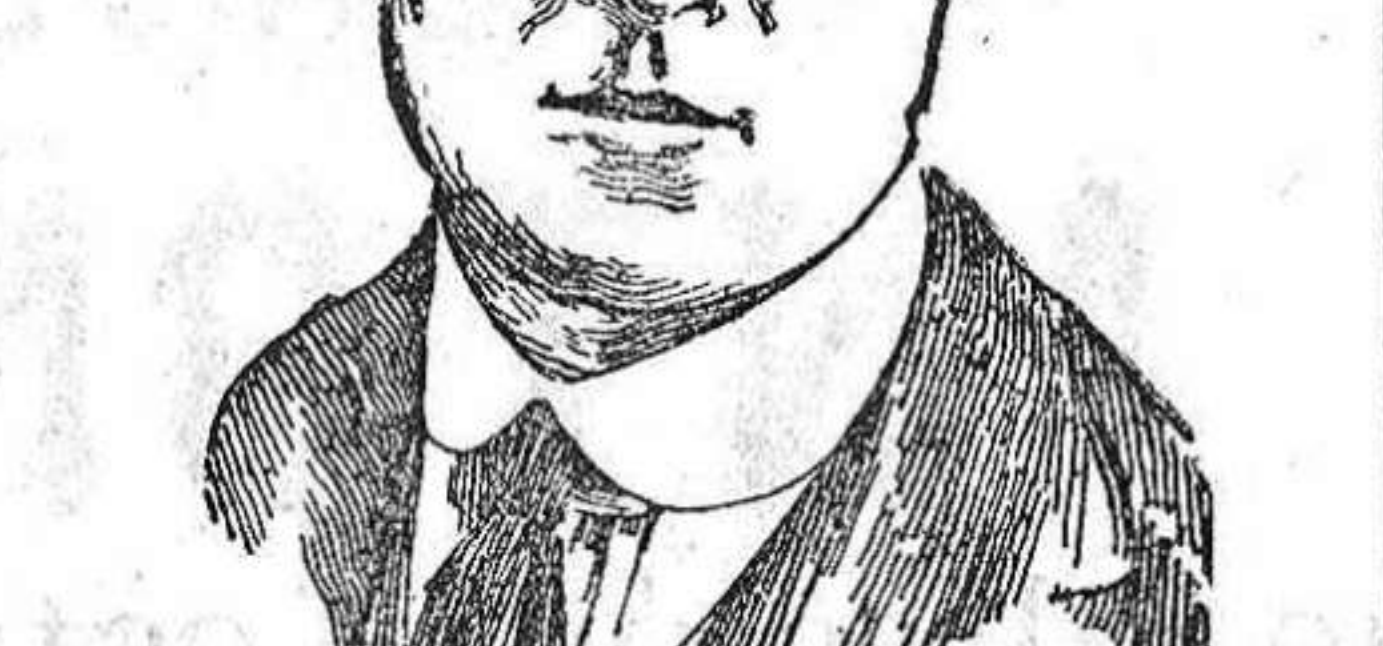
El aviador francés Brindejone, que ha sido ascendido a sub-teniente por méritos de guerra.