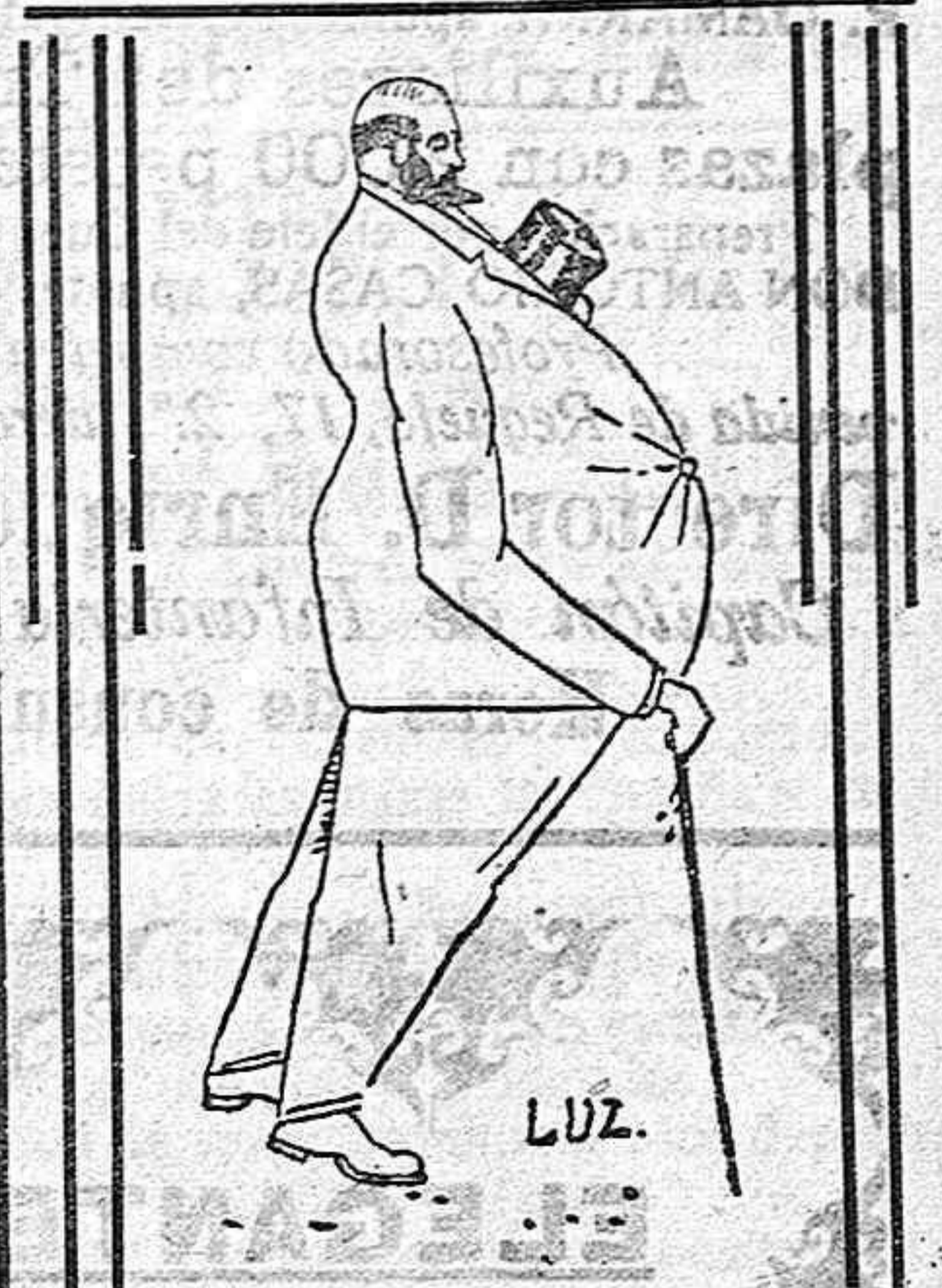
En este sexto mes de su «reñinado» el lapiz del gran Luz le ha sorprendido. Viéndole aquí estampado tan orondo y bien plantado, ¿nos explicáis de ayer el «estampado»?