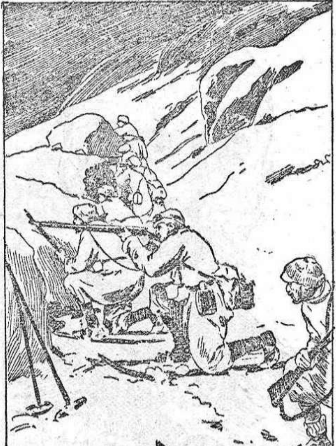
Patrulla de skiatori italianos batidos con un grupo de exploradores enemigos.