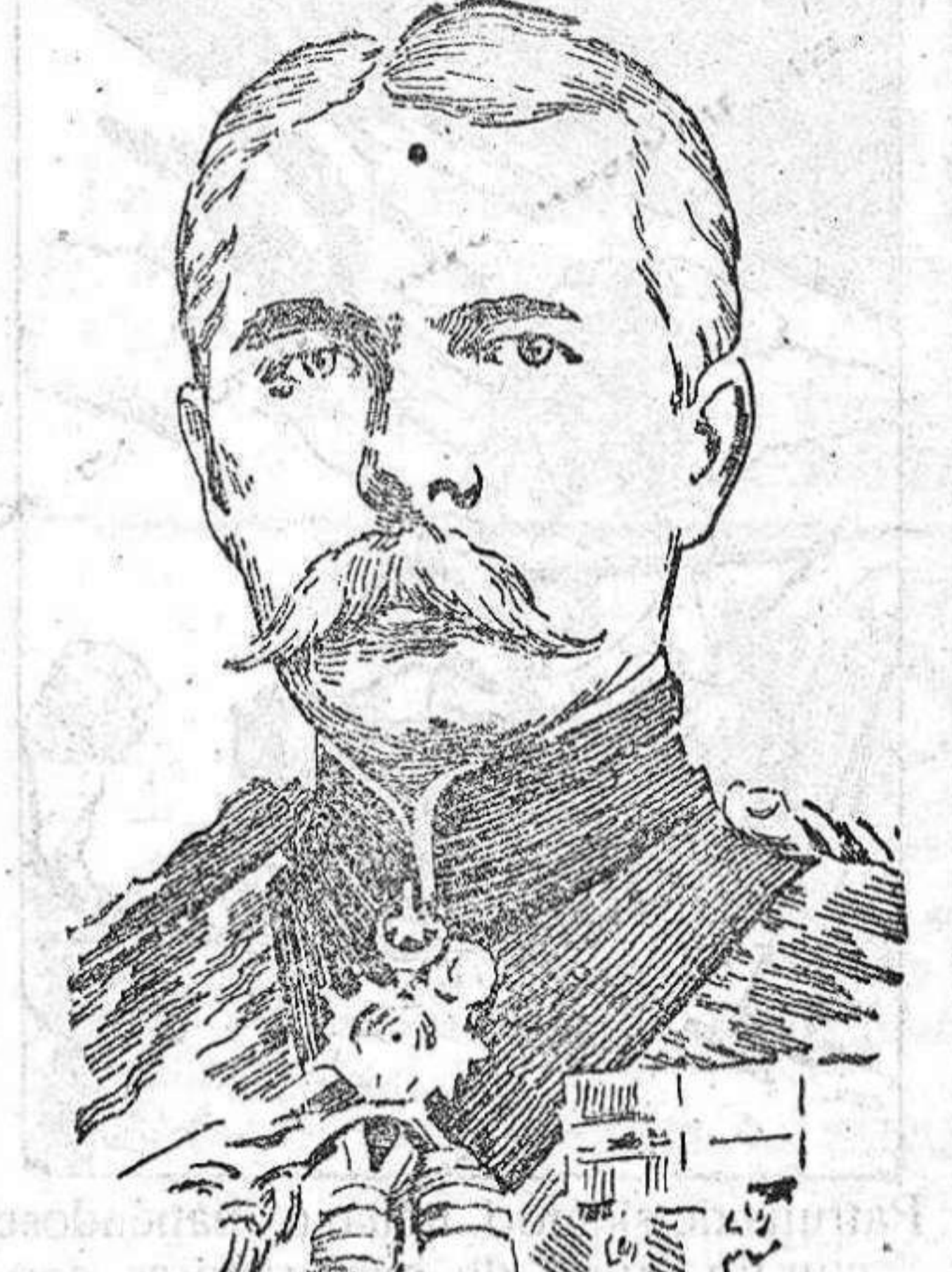
Lord Kitchener, ministro de la Guerra de la Gran Bretaña, que ha sido víctima del hundimiento del crucero Hampshire.