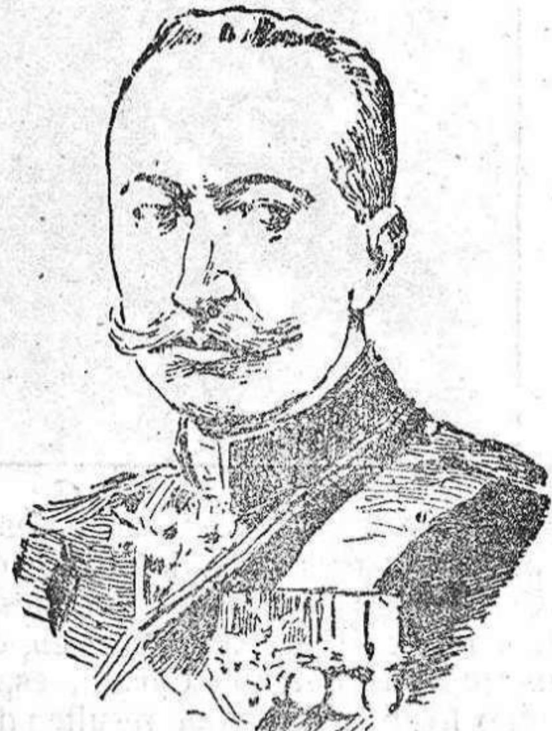
General Brusilof, que ha sustituido al general Ivanof en el mando del ejército de la Galitzia.

Doña Edmunda Bermejo Gacho, para Acberos.