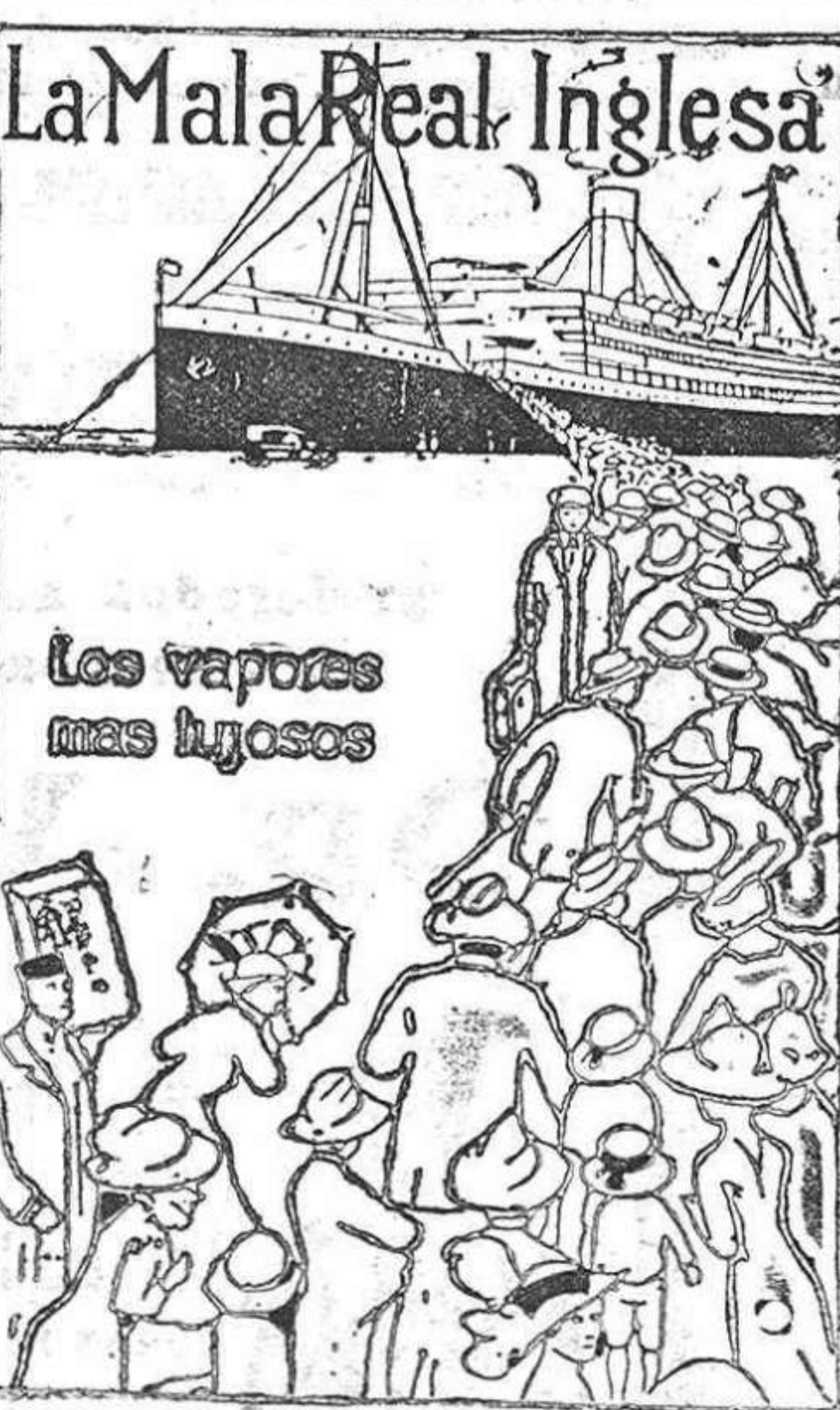
Los vapores mas ligeros

PERNAMBUCO BAHIA RIO JANEIRO SANTOS MONTEVIDEO Y BUENOS AIRES