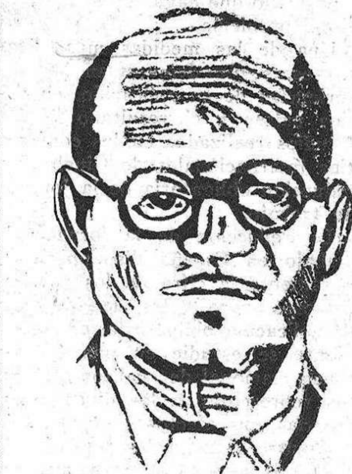
El capitán BARBERÁN, que según indica un papel que ha sido hallado dentro de una botella arrojada por el mar, se encuentra en una selva del Norte de Méjico, en unión del teniente Collar.

La nota está escrita sin faltas de ortografía y en un papel muy deteriorado, que se ve fué empleado para otras notas de la misma letra. El escrito está borroso y lo único que está claro es la firma de Collar.