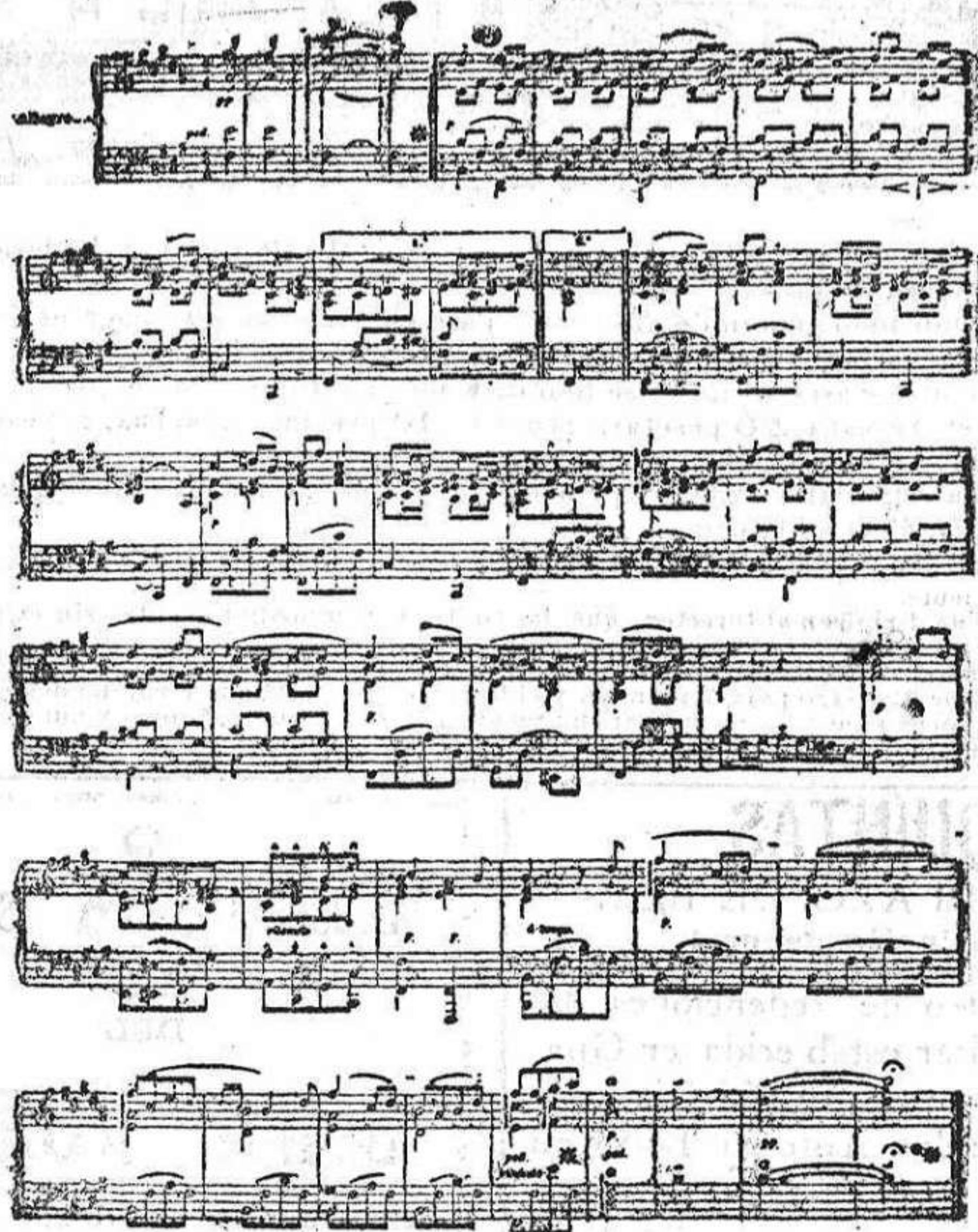
CANCIÓN ALEMANA PARA PIANO