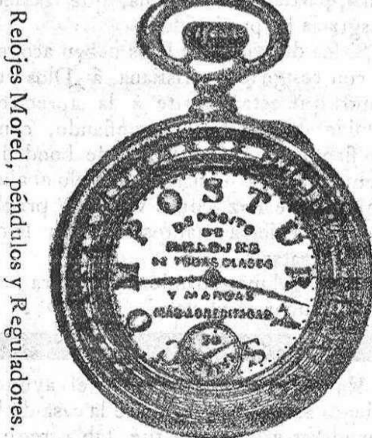
Relojes Mored, péndulos y Reguladores.