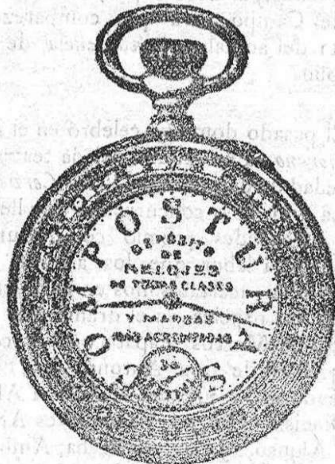
Relojes Mored, péndulos y Reguladores.