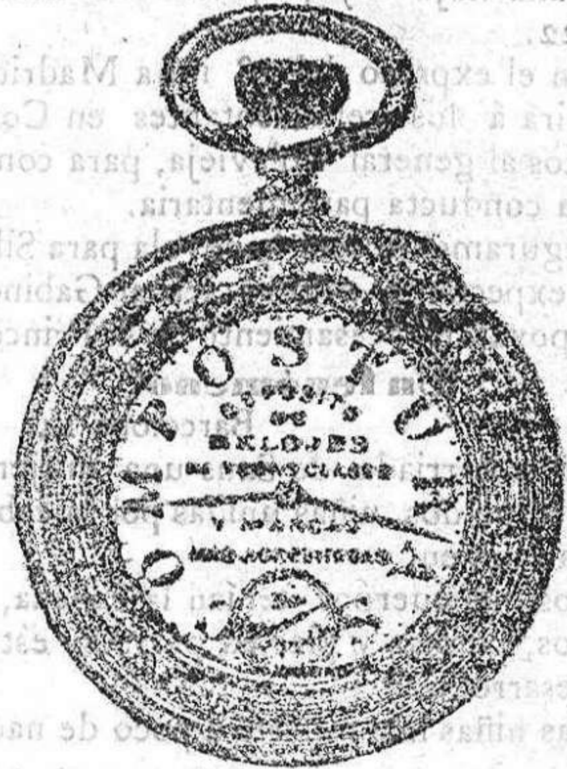
Relojes Mored, péndulos y Reguladores