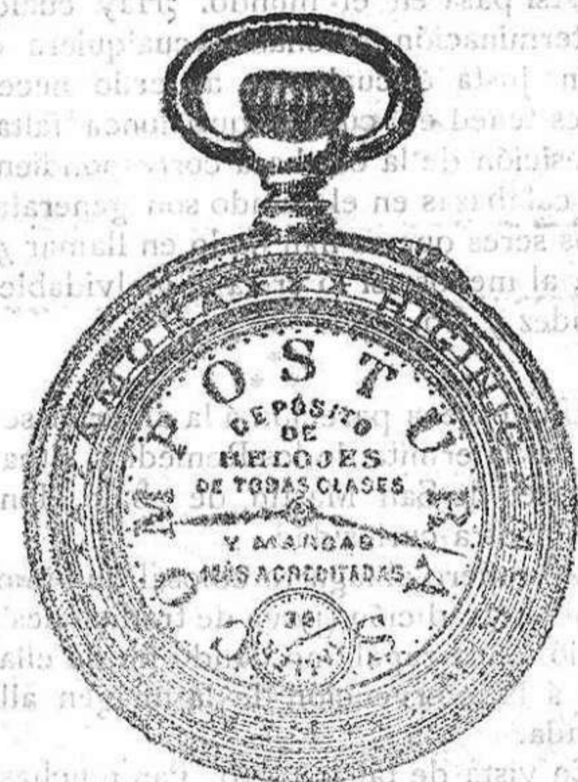
Relojes Merod, pendulos y Reguladores