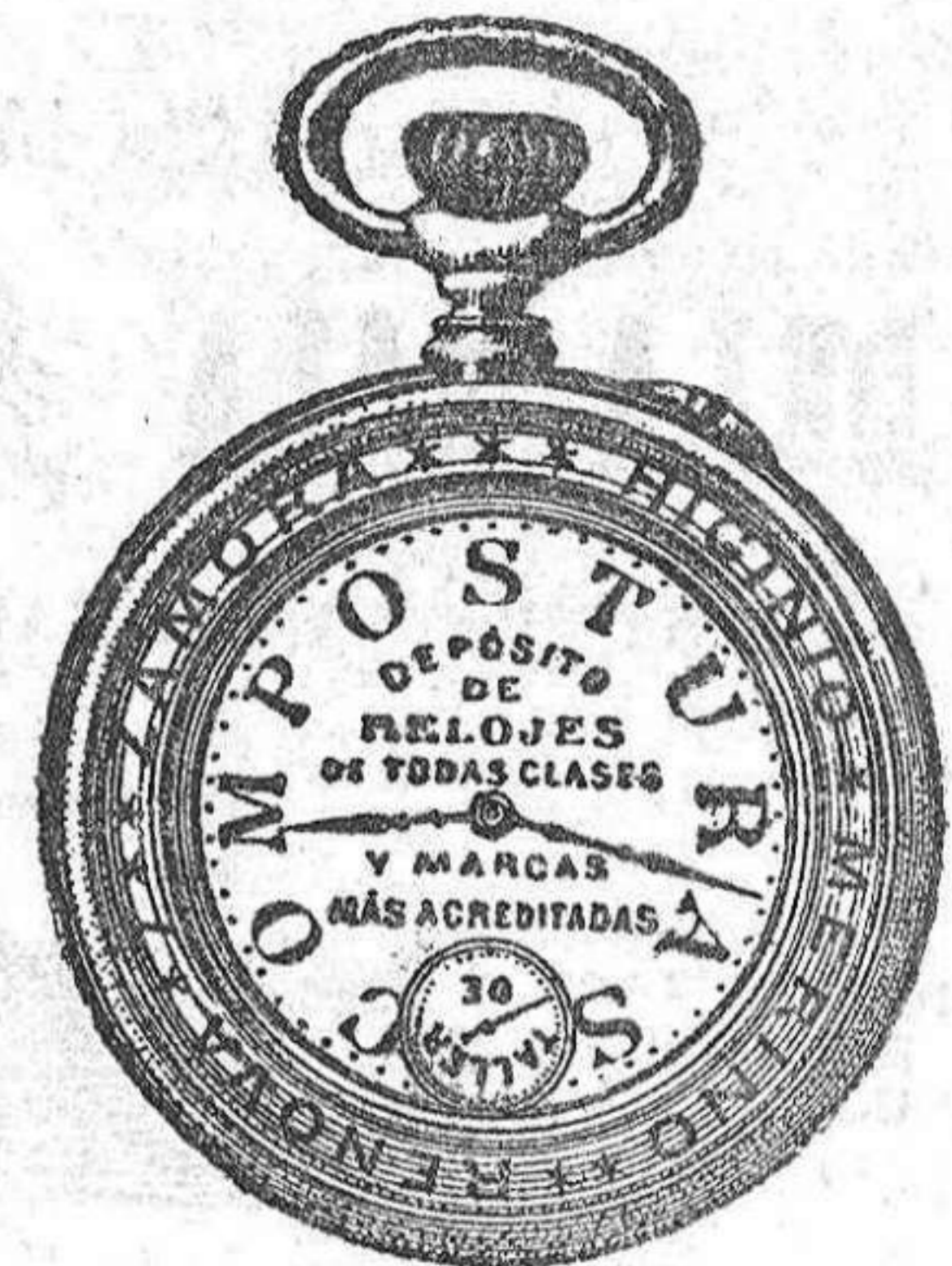
Relojes Mored, péndulos y Reguladores.