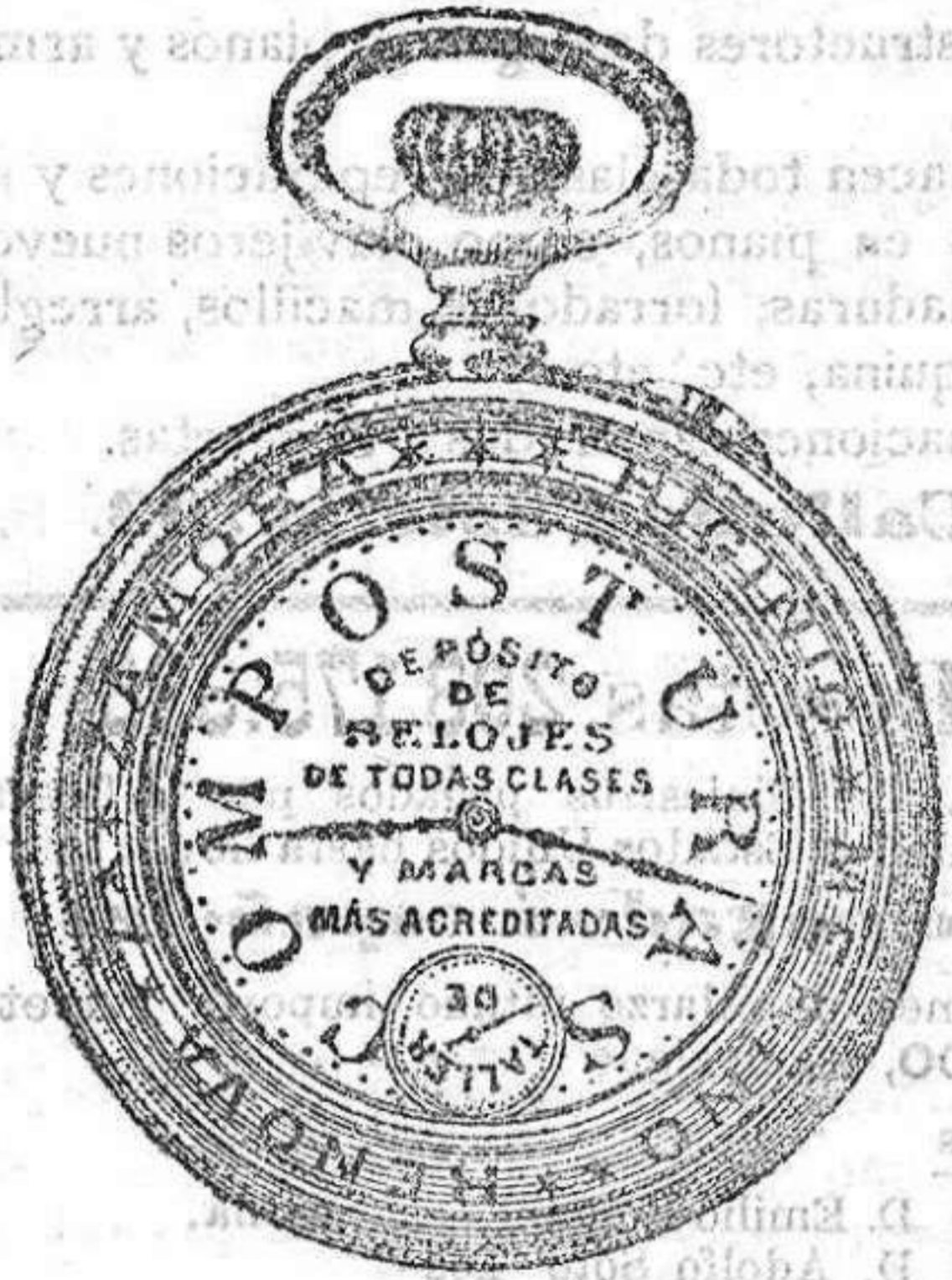
Relojes Mored, péndulos y Reguladores.