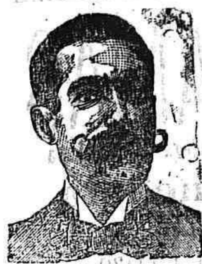
A. SALVATI COSTANZI Calle Diputación, 435 BARCELONA