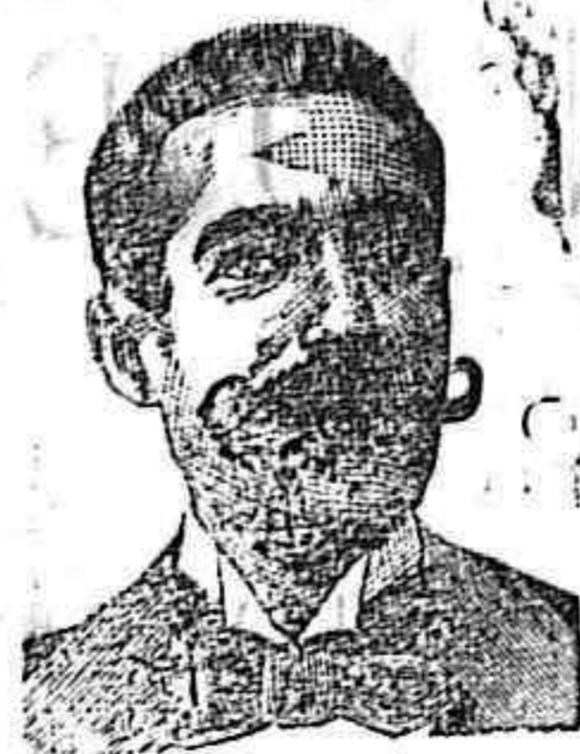
A. SALVATI COSTANZI Calle Diputación, 435 BARCELONA

El mejor remedio y el más económico para curar Pápilomas la BLENNORRAGIA y demás dolos de las vías urinarias. Precio 3 pesetas. VENTA: En todas las Farmacias de España, Portugal y América.—Depósitos en Palma: Farmacias de Valenzuela Hermanos, Plaza de la Cuartera y de la Libertad.