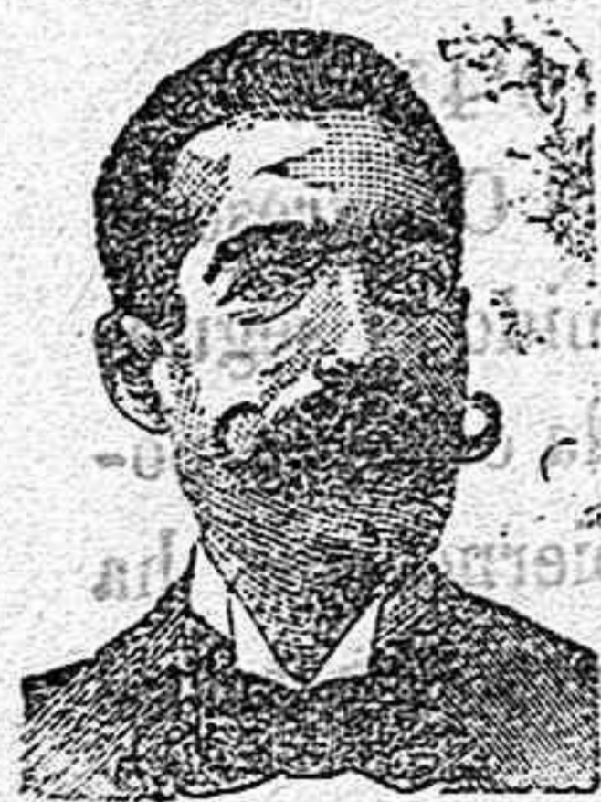
A. SALVATI COSTANZI Calle Diputación, 435 BARCELONA