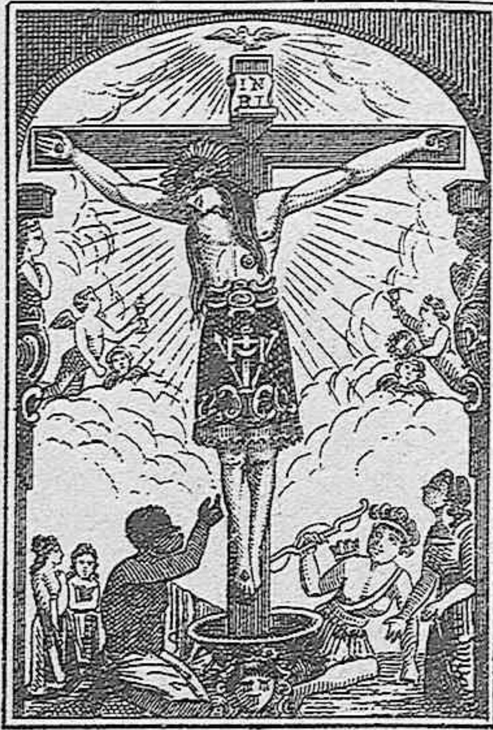
LA SANGRE PRECIOSISIMA DE JESUCRISTO.