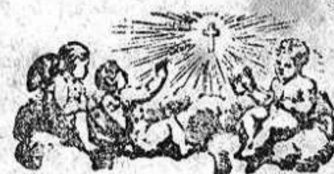
Santo de mañana.