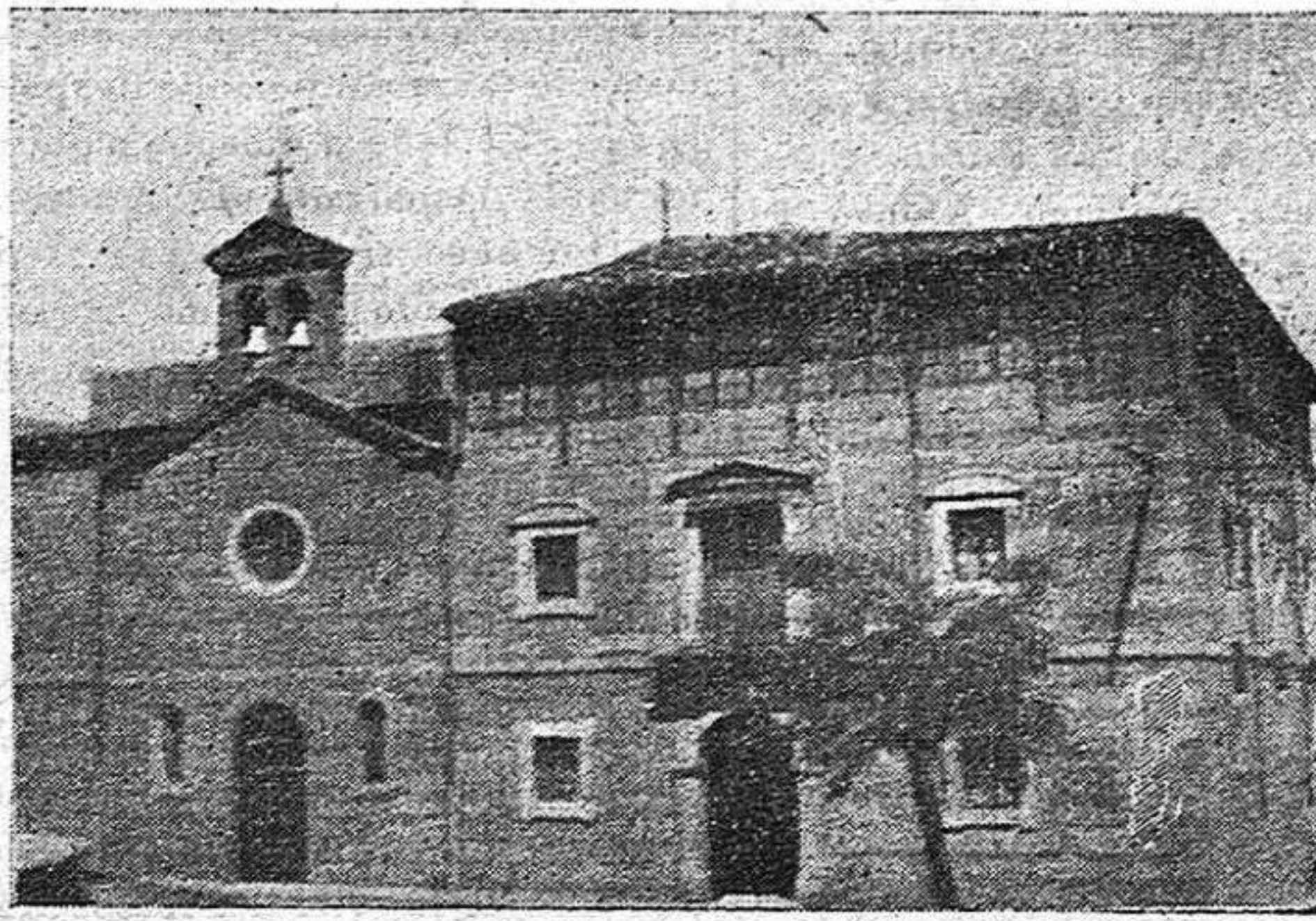
La residencia de las Siervas de Jesús, de Soria, que fué clausurado con gran solemnidad el viernes último.