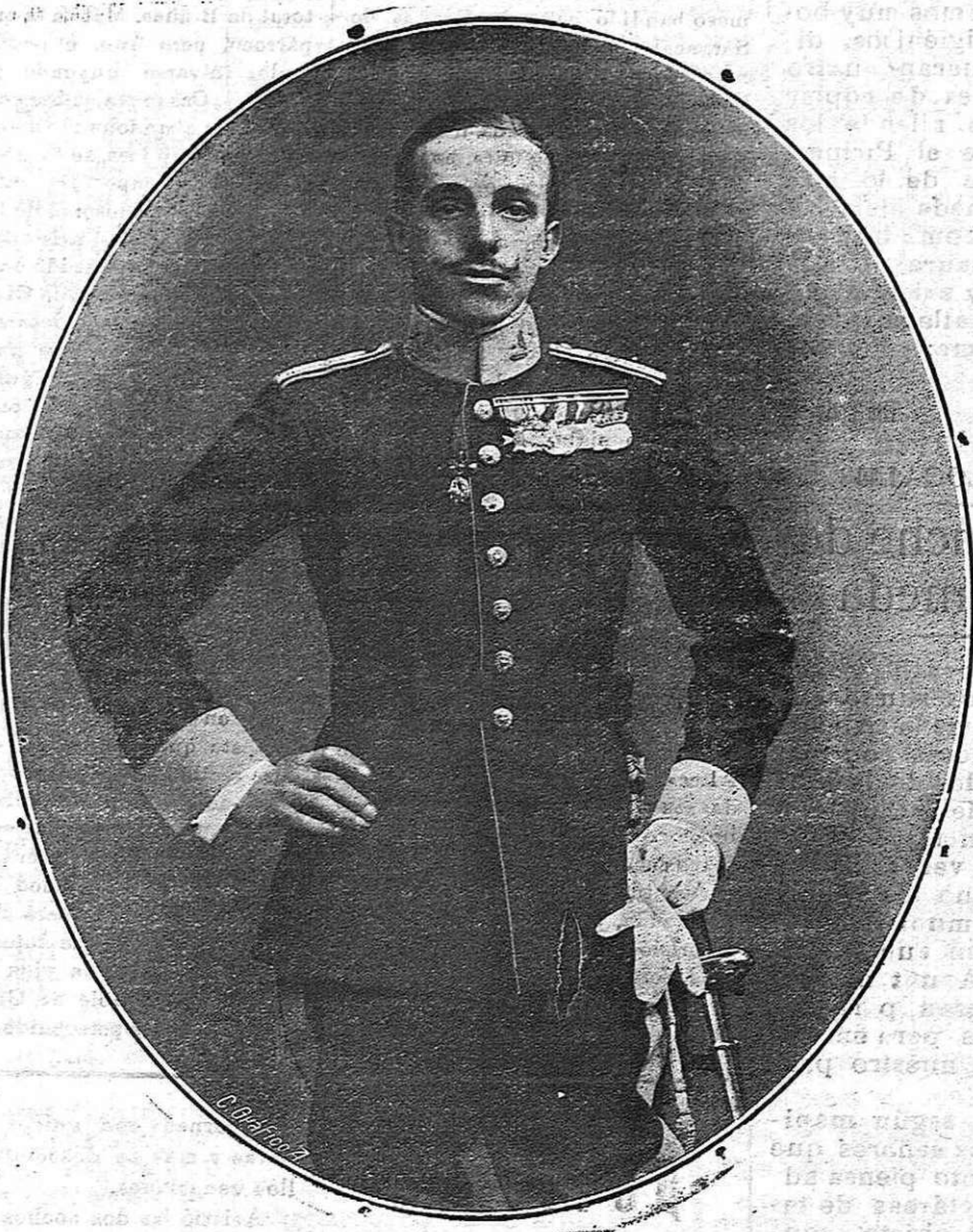
S. M. el Rey Don Alfonso XIII augusta persona que rige los destinos de nuestra Patria

Comunican de Beyruth que mientras los aeroplanos franceses bombardean las concentraciones de los rebeldes drusos en Djebel, el general Sarrail se ocupa en organizar los refuerzos que acaban de llegar para reprimir de modo definitivo la rebelión. La fecha del ataque francés se tiene en secreto, a fin de sorprender mejor a los revoltosos, que se encuentran concentrados en las cercanías de Soneida y del monte Hauran. Se sabe que el número de los rebeldes drusos y beduinos es de unos 20,000, que fortifican algunos puntos estratégicos y que envían constantemente emisarios a las aldeas árabes para procurar que se les unan los habitantes. Los rebeldes atacaron algunas aldeas del Noroeste de Hauran, en los alrededores de Kuneitra, pero no consiguieron el menor resultado.