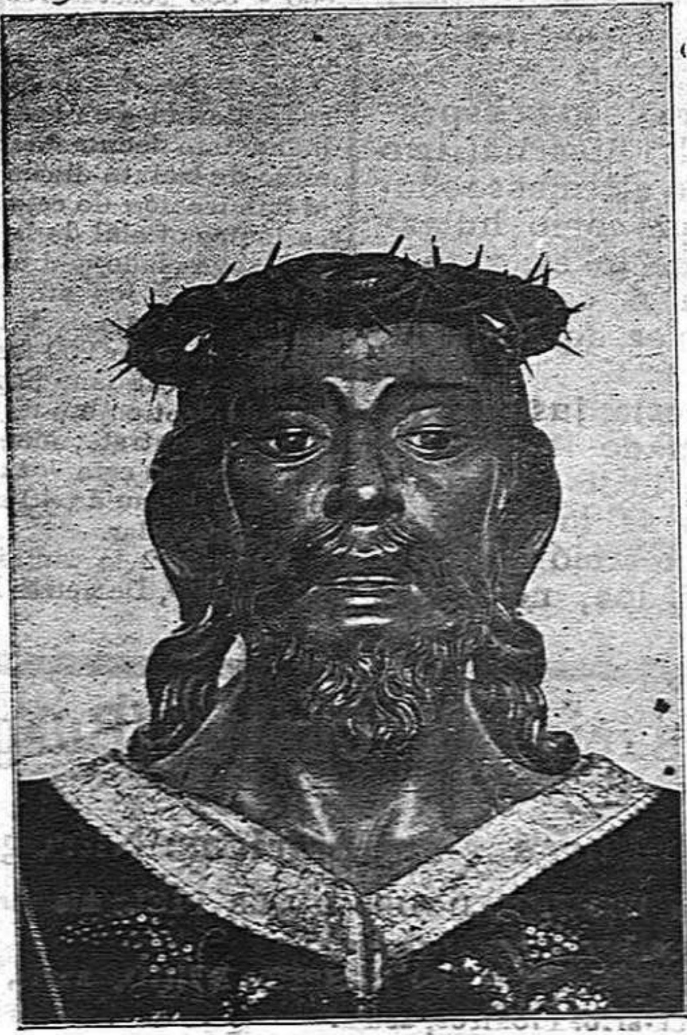
Jesús Nazareno, imagen del crucificado que se venera en la villa de Almazán donde se le rinde culto por las persecuciones que sufrió por salvar a los pecadores

La Comisión organizadora de los festejos llamados de otoño, que se han de celebrar en la villa y corte en el próximo mes de octubre, ha ideado, entre otros números, uno que será, indudablemente, el más original, el más pintoresco de todo el programa y el más adecuado para la propaganda del bíblico precepto del «crescite et multiplicamini». Consiste el tal número en la verificación de una lotería, en la cual no podrán participar más que los solteros y las solteras. No habrá más que un premio único, que será de un millón de pesetas. El soltero o soltera que resulten agraciados con el «gorde» de esta singular lotería, no podrán cobrar más que después de que hayan tomado esposa o esposa. La Comisión organizadora dará sabiamente un plazo prudencial al poseedor «in partibus» del millón, para decidirse a contraer matrimonial enlace. El día en que la boda, que se denominará «boda municipal», se efectúe, actuará de padrino el alcalde de Madrid y se dará a la ceremonia gran vistosidad y popularidad.