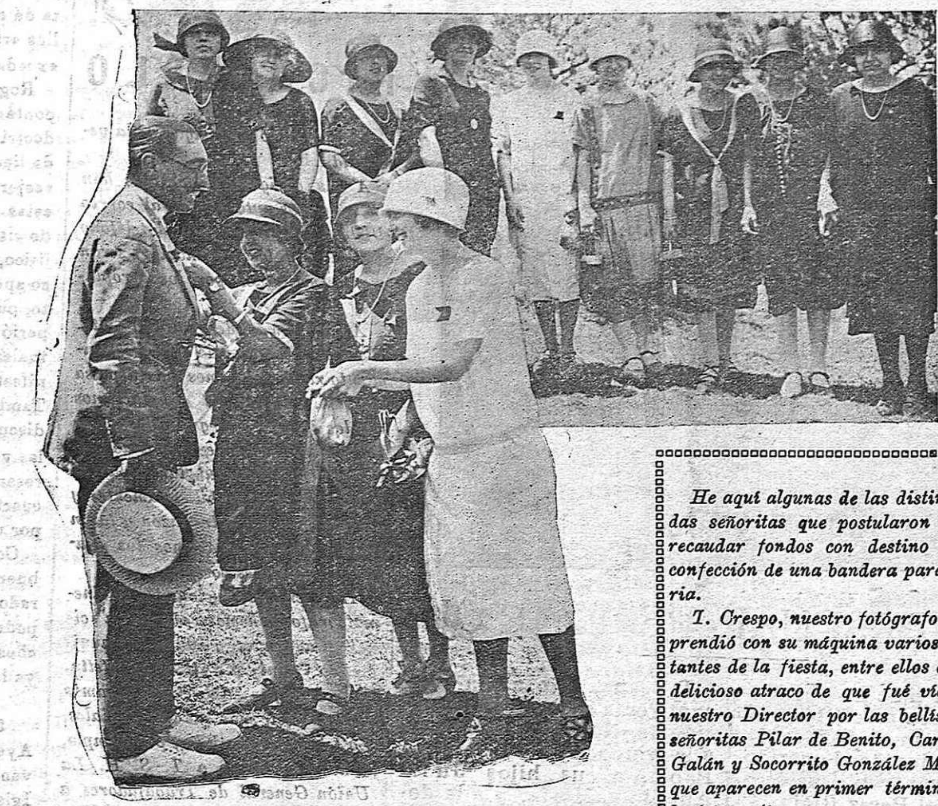
En la Alameda de Cervantes.—Un momento de la fiesta organizada por el comité de damas «pro bandera soriana».

VI.—El allanamiento de morada cometido con vio-