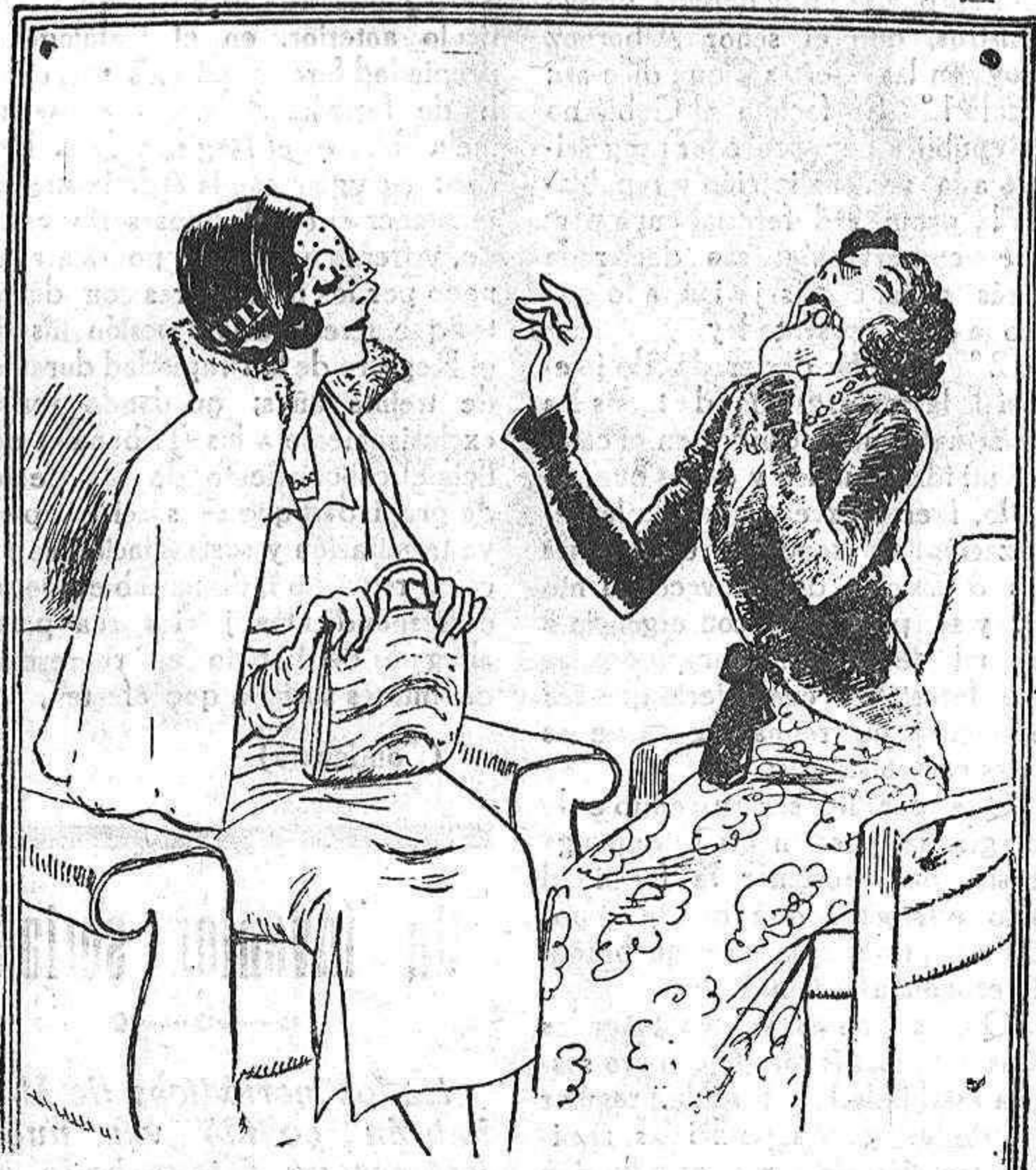
—Figúrate que horror. Voy a casa de una mujer para que me lea las arrugas de la mano y se me pone a leer las de la cara...