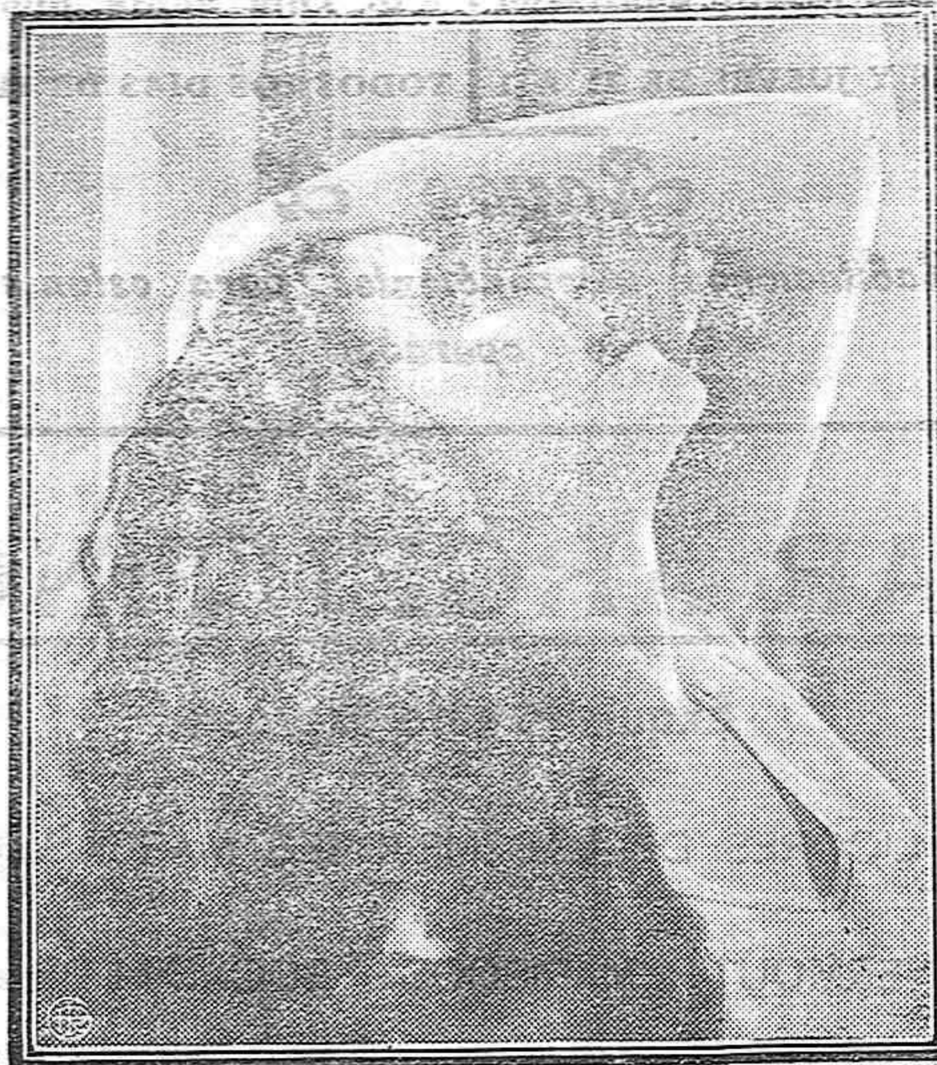
ROSITA MORENO, la genial intérprete del cine parlante hispanoamericano, ofrece a la contemplación de sus innumerables admiradores esta pose que es un fotogénico argumento para los detractores de la melena corta.