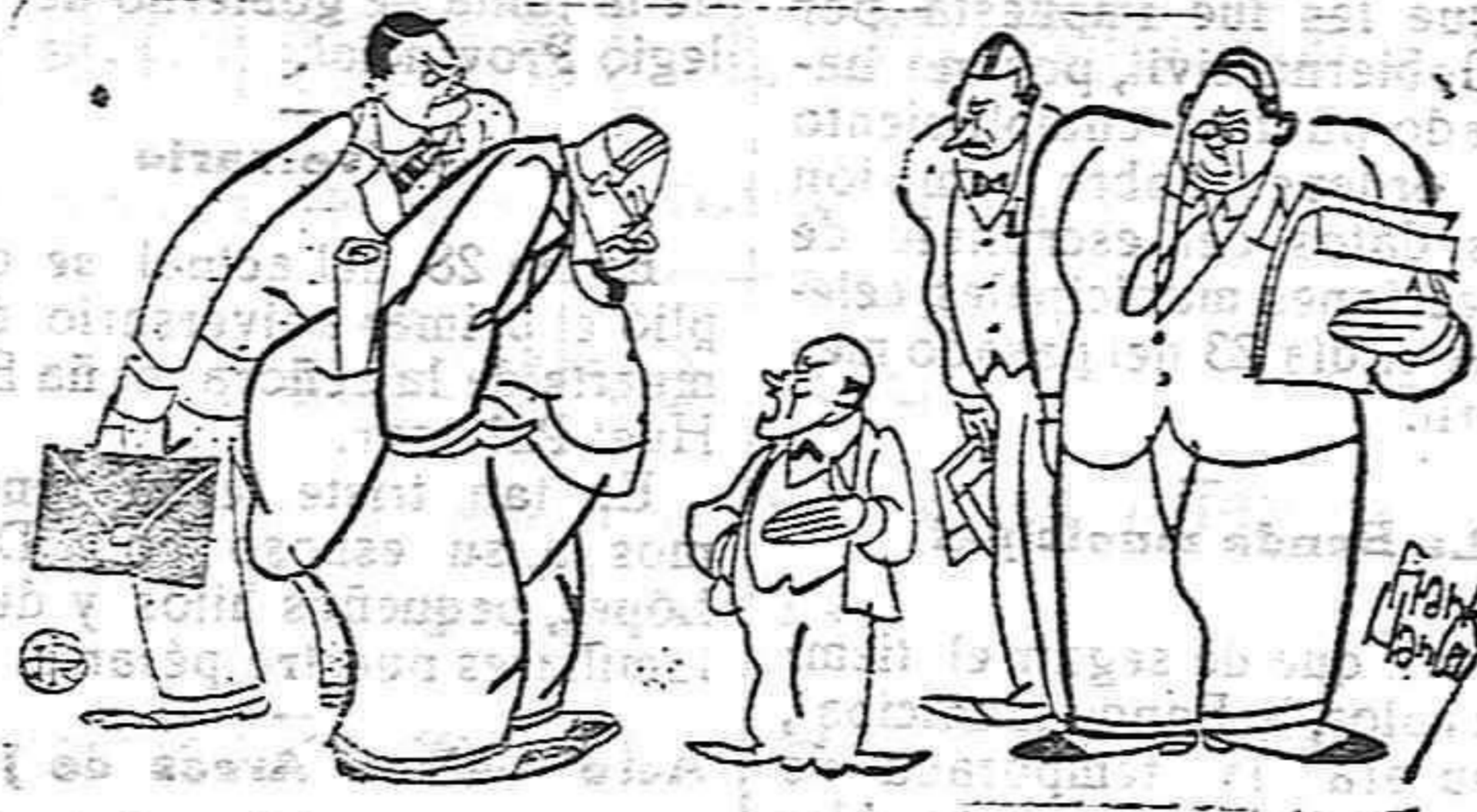
El caballero del centro: —Es que yo, señores, soy el mayor acreedor.