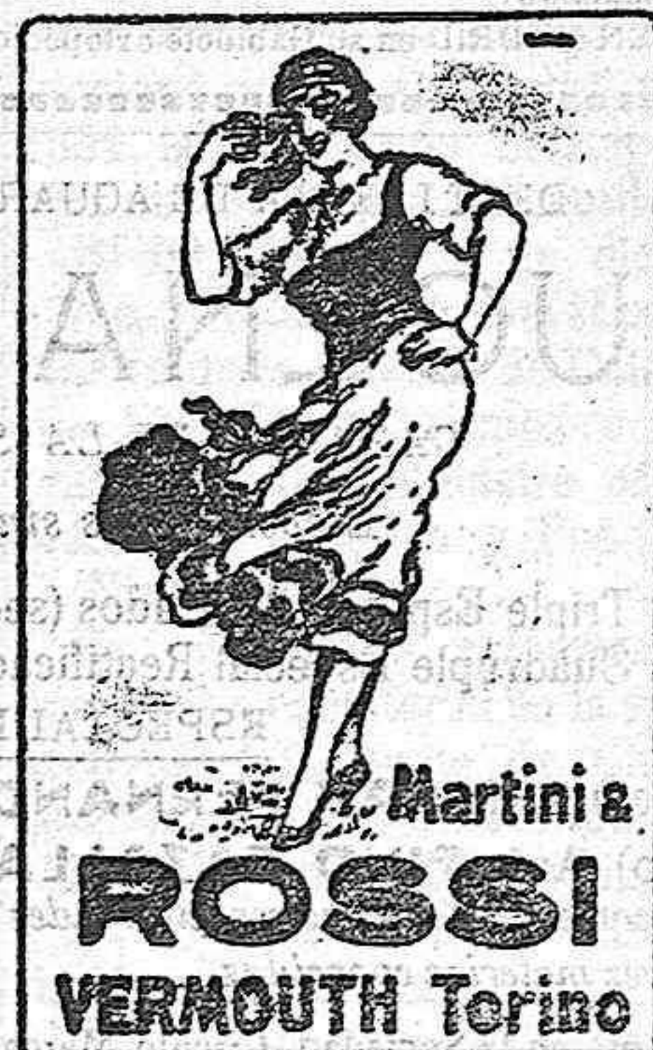
Se sirve en el Circulo Mercantil.