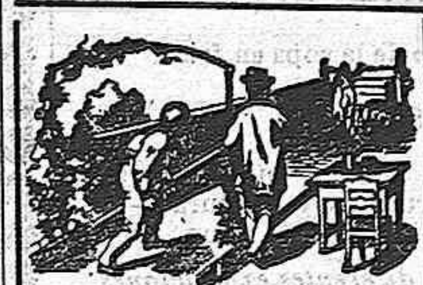
SPORT. Bolos alemanes.