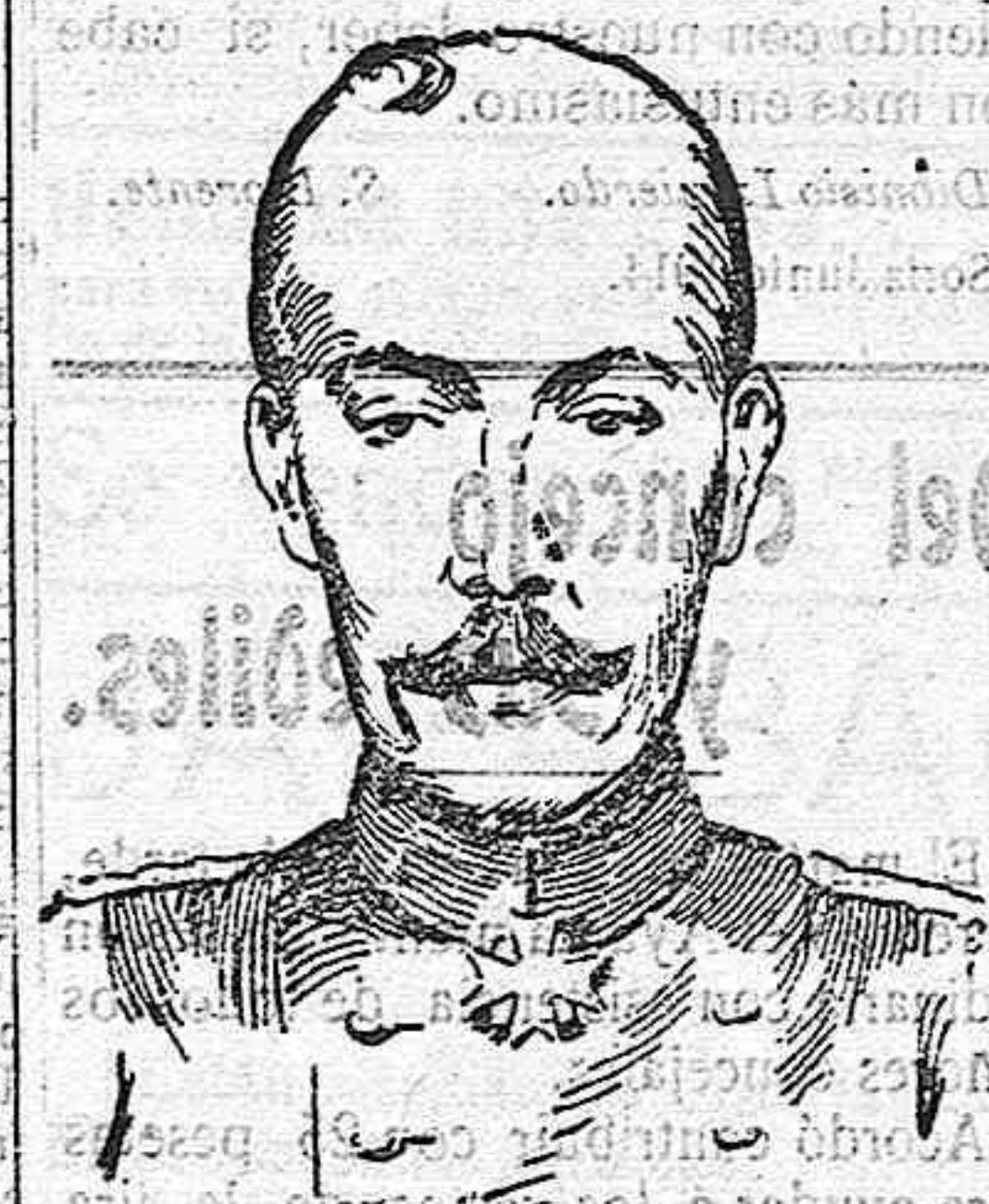
EL PRÍNCIPE WIED

Hoy se anuncia como más que probable una guerra religiosa en Albania, y como si esto fuera poco para quebrantar la tranquilidad de Europa, las diferencias austro-italianas continúan avanzando hacia grave crisis.