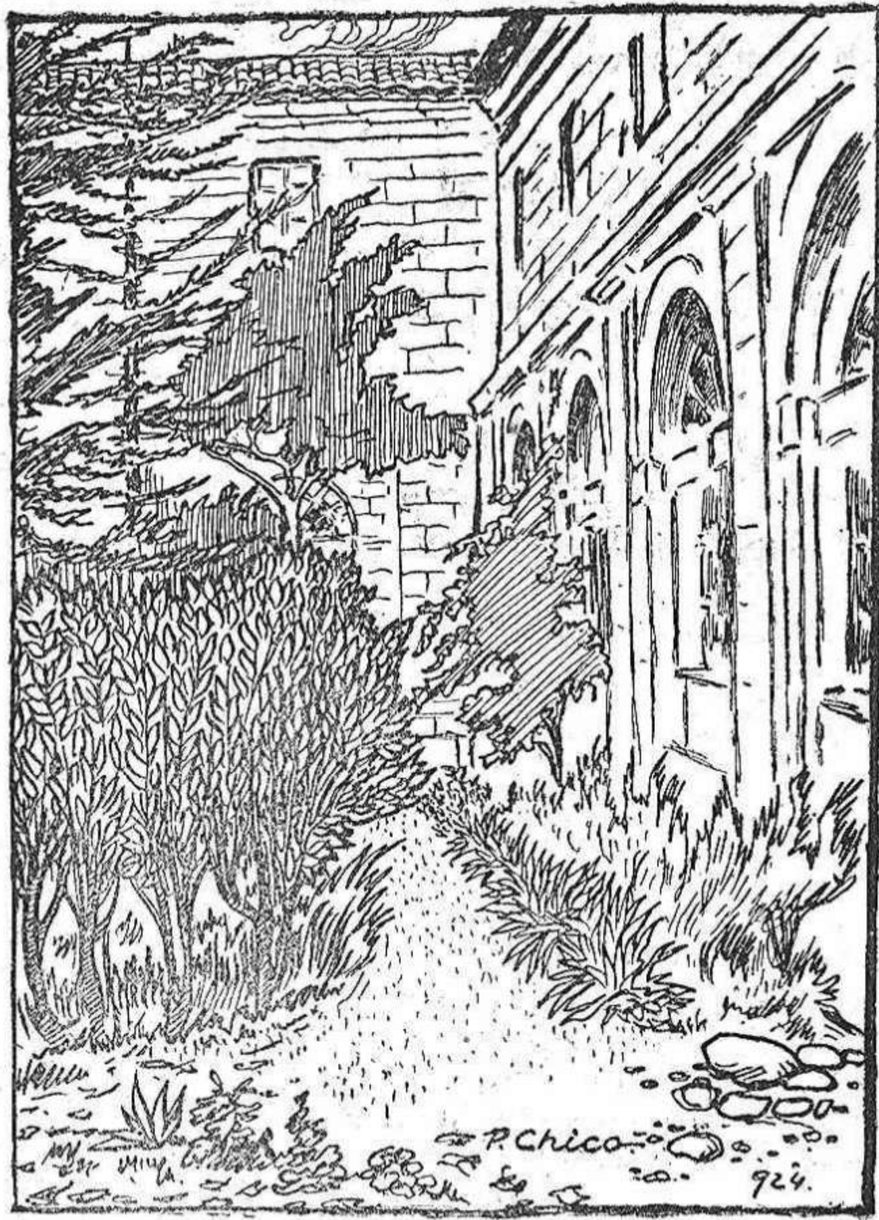
«...y el jardín del Instituto»

que remordimiento tétrico. Por la ventana parecía salir un fulgor extraño. Nos detuvimos un momento; pero el más decidido dijo en voz alta. —¿Por qué hemos de dejarlo así? ¡Vamos adelante! Y abrió la puerta. Nos quedamos sobrecogidos; ante nosotros se presentaba un imprevisto y lastimoso espectáculo: en el centro de la habitación había un paño negro, rodeado de cuatro blandones y, en medio, amarillo, rígido, sin vida, yacía el cuerpo de Jenaro.