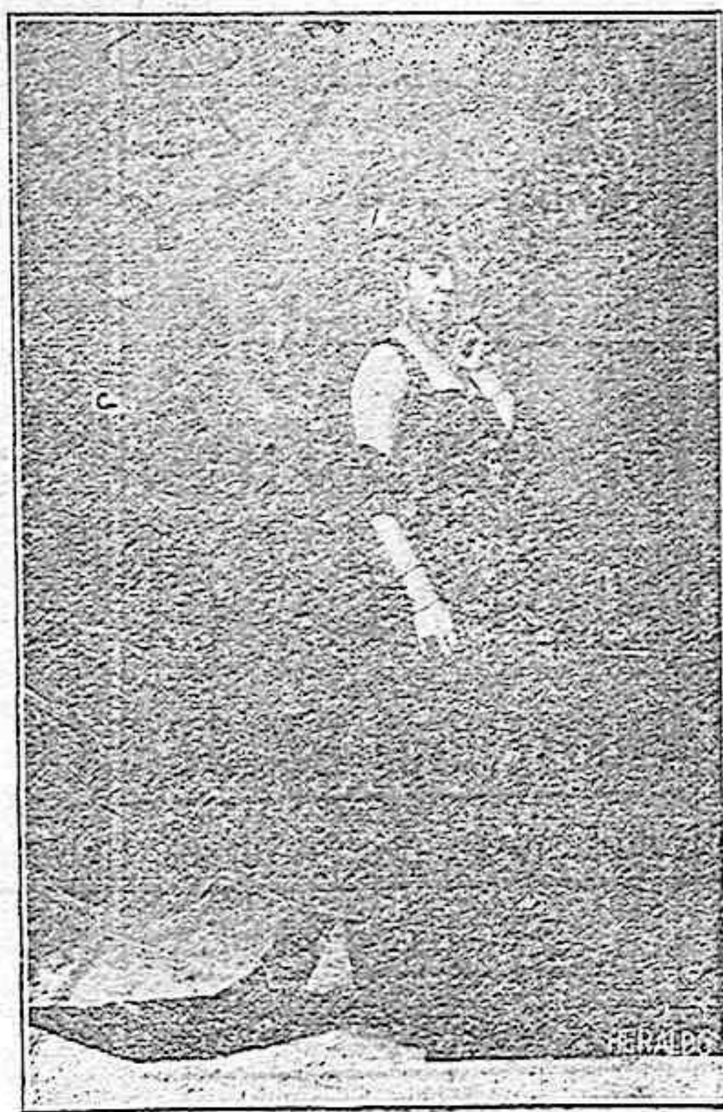
Mañana, DEBUT de la Compañía de MARGARITA XIRGU.