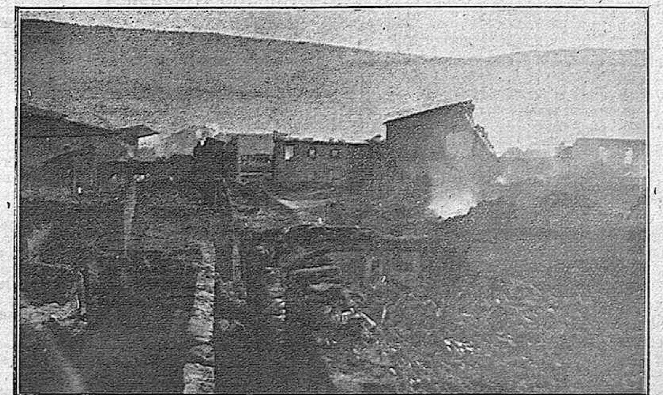
VISTA DE LOS EDIFICIOS SINISTRADOS