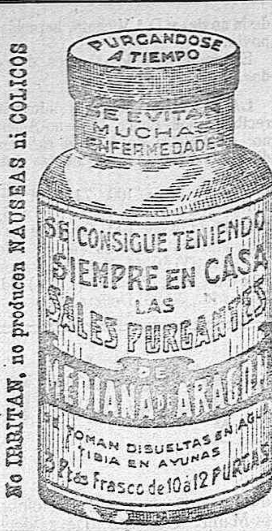
NO DEBRYAN, no producen NAUSEAS ni COLICOS